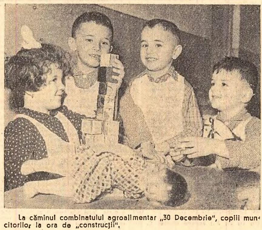
La câminul combinatului agroalimentar „30 Decembrie”, copiii muncitorilor, la ora de „construcții”.

Studiind cu toată grija experiența înaintată din fiecare organizație de bază, comitetele raionale și orașenești de partid trebuie nu numai să extindă această experiență, dar să și ia, pe baza ei, măsuri politice și organizatorice, care să împingă înainte munca de partid.