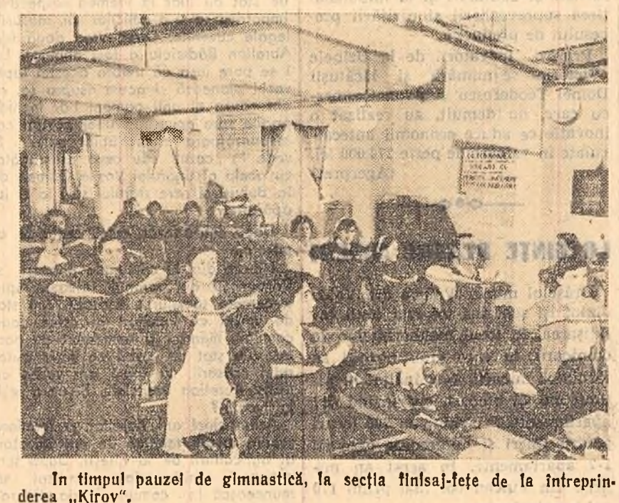
În timpul pauzei de gimnastică, la secția filasaj-fețe de la întreprinderea „Kirov“.

★ Cu toate acestea în orașele Baia Mare, Timișoara și altele, U.C.F.S. urmează și conducerea unor întreprinderi nu au luat încă măsuri pentru introducerea și extinderea gimnasticii în producție. Studiarea posibilităților de introducere și desfășurare în bune condiții a gimnasticii în producție se impune în toate întreprinderile, precum și în unitățile socialiste din agricultură.