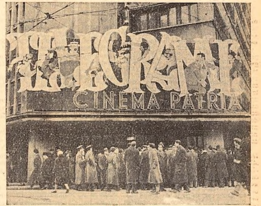
„N-aveți un bilet în plus?” (Ieri, în fața cinematografului „Patria” din Capitală, unde rulează noul film românesc „Telegame”).