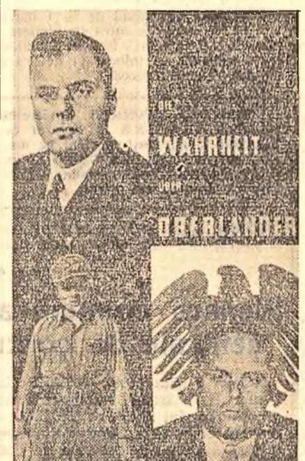
În clișeu: coperta „Cărții Brune” — „Adevărul despre Oberländer”. În partea din stînga jos a coperii este fotografia lui Oberländer în uniformă nazistă.