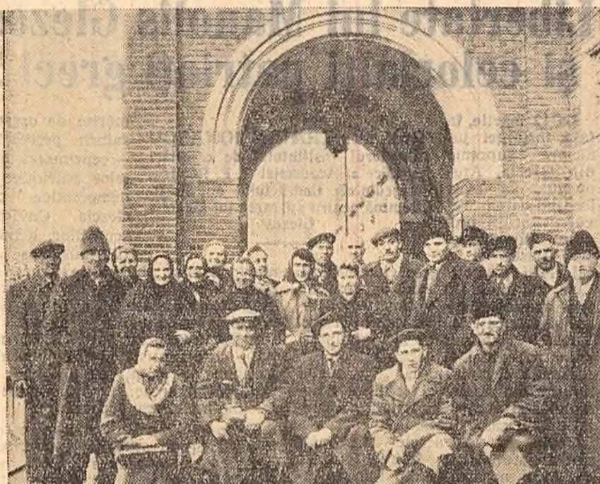
Peste 370 de colectivisti din regiunea Stalin au vizitat ieri Muzeul Lenin-Stalin. Colectivisti au sosit in Capitala in cadrul unei excursii organizate de O.N.T. 'Carpaj'. In fotografie: un grup de colectivisti in fata muzului.