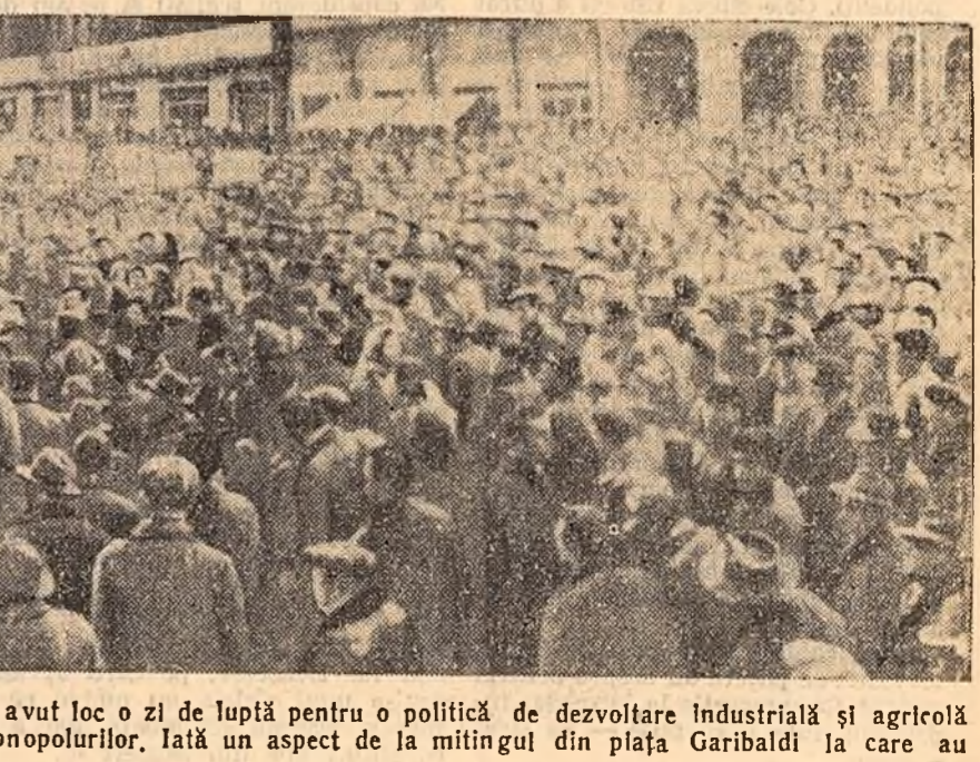
Recent, la Bologna (Italia) a avut loc o zi de luptă pentru o politică de dezvoltare industrială și agricolă a regiunii, împotriva dominației monopolurilor, la un aspect de la mitingul din piața Garibaldi la care au participat peste 20.000 de oameni.

Deși se vorbește mult despre o formulă „de centru”, nici un ziar nu înclină să la drept sigură o astfel de formulă întrucît se manifestă tendința unor cercuri de dreapta și de extremă dreapta de a împune un guvern de dreapta.