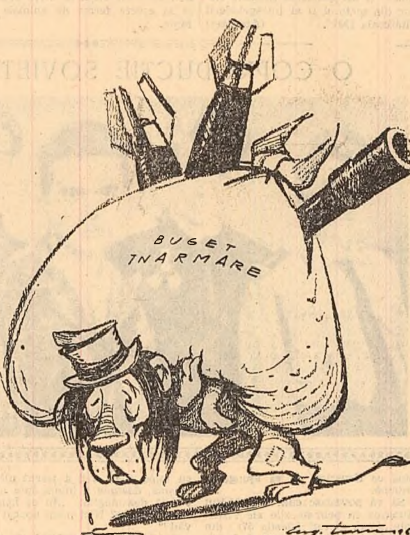
Leul britanic: — Și toate acestea, ...ca să devin mai puternic? ... Desen de EUGEN TARU

erat din partea statului Louisiana) a stabilit un record... vorbind neîntrerupt timp de nouă ore și 21 de minute, relatează agenția Associated Press. Ședinta Senatului, care și-a început lucrările la 29 februarie, continua încă în dimineața de 3 martie.