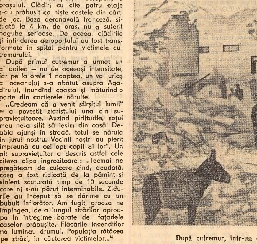
După cutremur, într-un cartier al orașului Agadir.

După primul cutremur a urmat un al doilea — nu de aceeași intensitate, dar pe la orele 1 noaptea, un val uriaș al oceanului s-a abătut asupra Agadirului, inundînd coasta și mîturînd o parte din cartierele năruite.