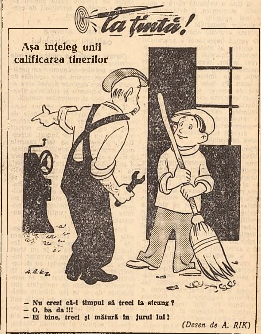
— Nu crezi că-l timpul să trec la strung? — O, ba da!!! — El bine, treci și mătură în jurul lui! (Desen de A. RIK)