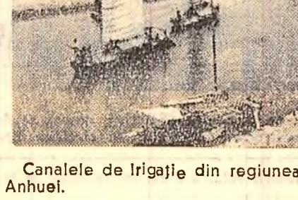
Canalele de irigație din regiunea Fu Yan, provincia Anhui.

● Închisă înaintea de a pleca la Anhui, auzim că la Mey Shan se află un baraj mai înalt decît Battlet — cel mai mare baraj din America de Sud. Ne-am oprit deci la Mey Shan. Am găsit într-adevăr o construcție monumentală. Un gigant de beton armat, înalt de peste 88 de metri, care captează torenții munților Taipie.