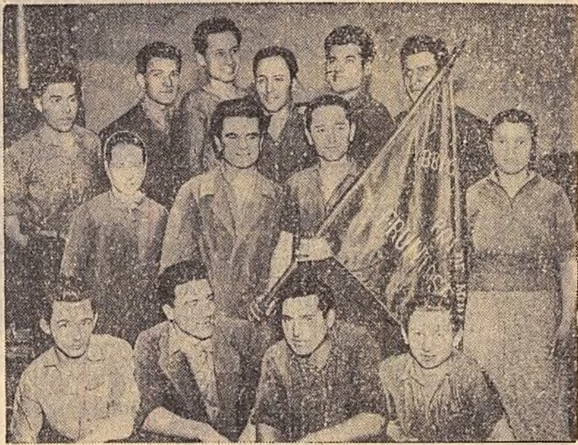
De curînd brigada nr. 2 de muncă patriotică de la uzinele de tractoare „Ernest Thälmann” din Orașul Stalin a fost distinsă cu steagul roșu de brigadă fruntaș pe oras.

O contribuție de seamă la obținerea acestui important succes au avut muncitorii, tehnicienii și inginerii din secția blumîng, care în perioada 1 ianuarie-15 martie a.c. au produs 18.290 tone laminată peste plan.