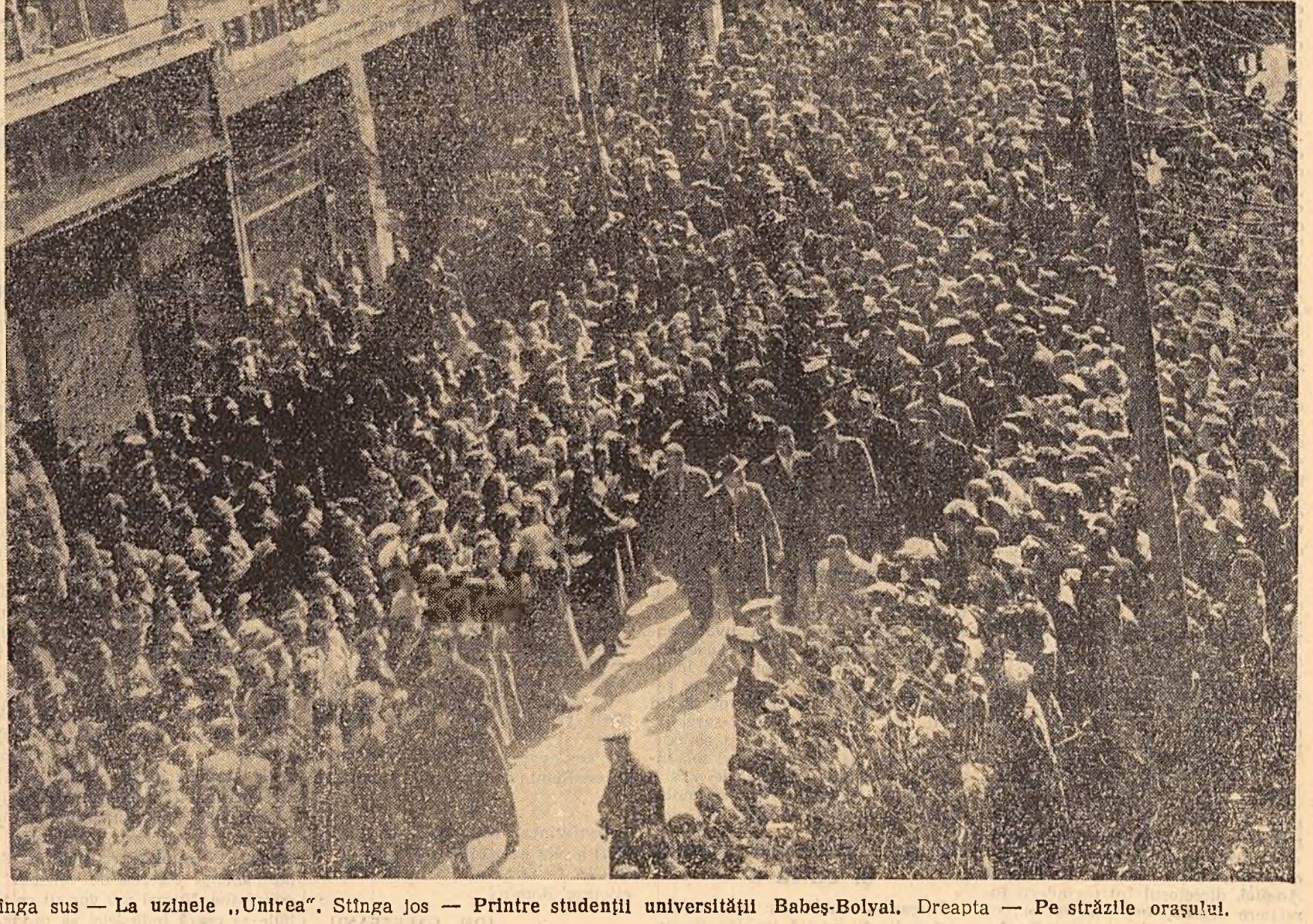
Vizita tov. Gheorghie Gheorghiu-Dej la Cluj. În fotografiile: stînga sus — La uzinele „Unirea”. Stînga jos — Printre studenții universității Babeș-Bolyai. Dreapta — Pe străzile orașului.