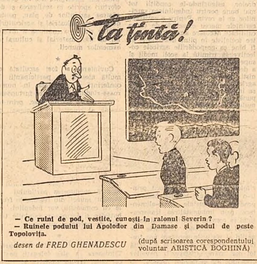
— Ce ruini de pod, vestite, cunoști în raionul Severin? — Ruinele podului lui Apolodor din Damasc și podul de peste Topolovița. desen de FRED GHENADESCU (după scrisoarea corespondentului voluntar ARISTICA BOGHINA)

De un deosebit succes s-a bucurat echipa de teatru a cîmînului cul-tural din Ada-kaleh, care a fost se-lecționată pentru a participa la fa-za raională a concursului.