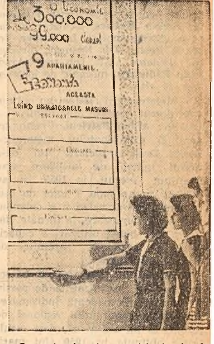
Organizația de partid de la fa-brica „Pavel Tcacenco” din Capitală folosește larg agitația vizuală în sprijinul îndeplinirii și depășirii sar-cinilor de plan. Iată un grup de muncitoare în fața unui panou ex-pus recent.