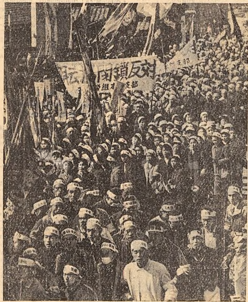
Peste 30.000 de mîneri din bazinul carbonifer Miike (Japonia) au demonstrat recent împotriva înarmării atomice a Japoniei și a „tratativelor de securitate” cu S.U.A.

Se arată de asemenea că în ultimul timp autoritățile engleze au început să strămute cu forța pe băștinii din aceste regiuni. Săptămîna trecută englezii au strămutat cu forța 60 de familii din satul Kenyan.