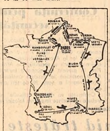
Traseul călătoriei prin Franța.

● La Asociația presei diplomatice: cînd seful guvernului sovietic sunea cite o glumă, aplauzele frenetice începeau încă înainte ca aceste cuvinte să fie traduse în limba franceză. Se pare că în rîndurile diplomaților și ziaristilor cunoașterea limbii ruse se încetățenește din ce în ce mai mult.