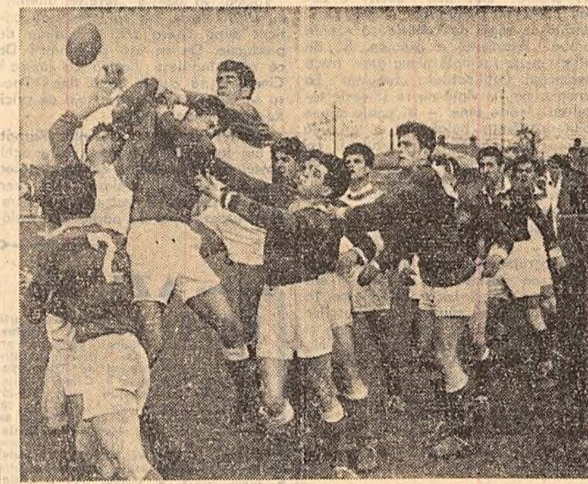
Ieri, pe stadionul uzinelor „Republica”, s-a disputat meciul de rugbi C.C.A. Metalul, cîștigat la mare luptă de echipa militară (3-0). „Green” jocului l-au dus înaintările, al căror echilibru de forțe a fost vizibil. În fotografie: Un aspect din timpul meciului.

VICTOR BARBU Ing. agronom la G.A.C. Comana, regiunea Constanța