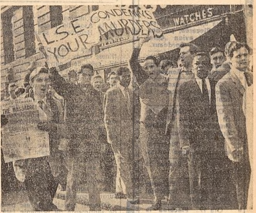
Studentii sudafricani care studiază la Londra manifestează pe străzile capitalei Marii Britanii, împotriva masacrelor săvârșite de rasisti din Uniunea sudafricană.

LONDRA 26 (Agerpres). — Protestele opiniei publice mondiale împotriva represiunii bestiale puse la cale de poliția sudafricană împotriva demonstrațiilor pasnice de la Sharpeville, în cursul căreia și-au pierdut viața peste 200 de persoane, nu împiedică guvernul Uniunii Sudafricane de a organiza noi represiuni. La 24 martie agențiile de presă străine au anunțat că autoritățile au interzis organizarea de adunări și mitinguri în toate marile orașe din Uniunea Sudafricană.