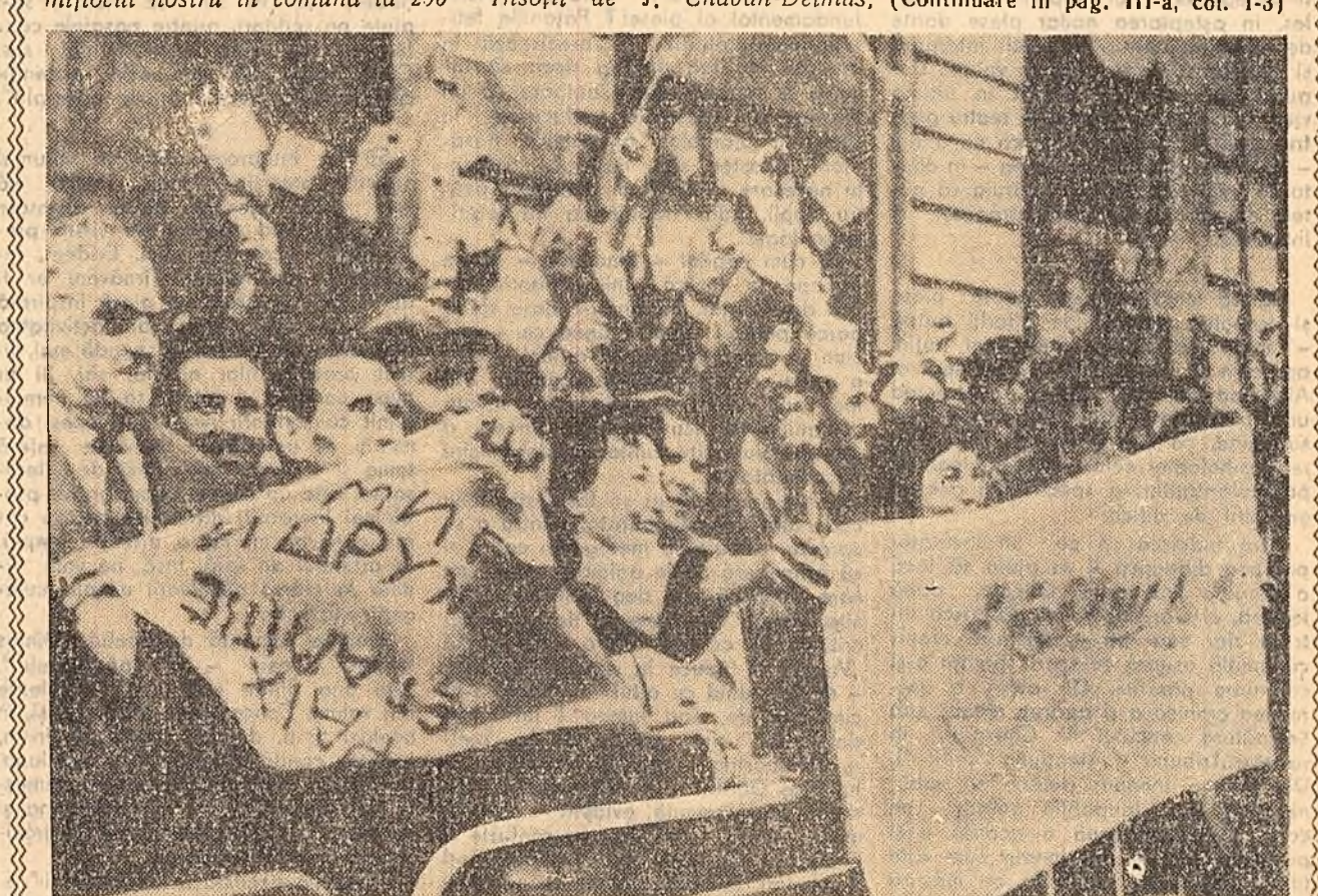
Trecerea oaspeților stîrșnește entuziasm pe străzile orașului Bordeaux

Însoțit de J. Chaban-Delmas, (Continuare în pag. III-a, col. 1-3)