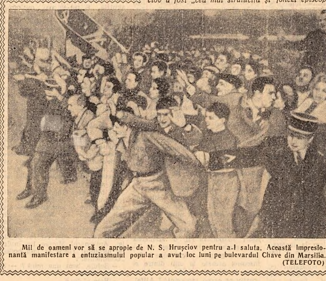
Mil de oameni vor să se apropie de N. S. Hrușciov pentru a-l saluta. Această impresiune manifestare a entuziasmului popular a avut loc luni pe bulevardul Chave din Marsilia.