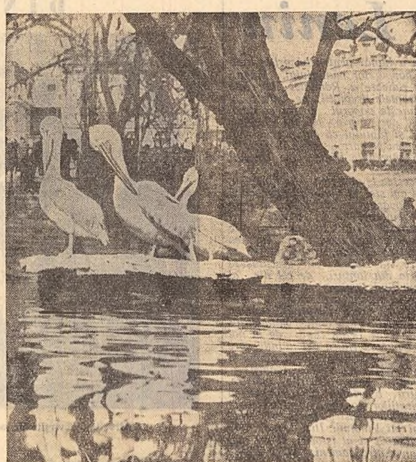
Zi de primăvară în Cișmigiu.

Conf. univ. PETRE RAICU, candidat în științe agricole (Rubrică redactată de redacția revistei „Știință și Tehnică”).