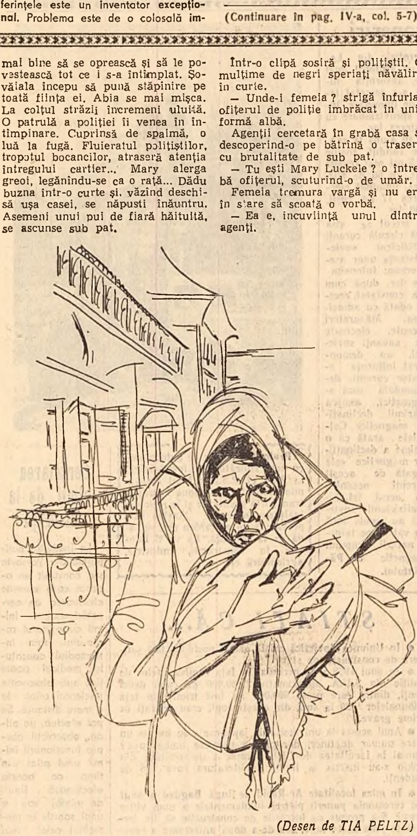
(Desen de TIA PELTZ)

*) Consiliul Comisarior poporului. (Continuare în pag. IV-a, col. 5-7)