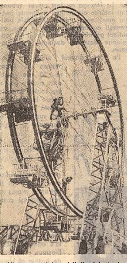
Ultima revizie... Michi vizitatori ai 'Parcului de cultură și odihnă I. V. Stalin' așteaptă cu emoție să se urce în scrinclob.