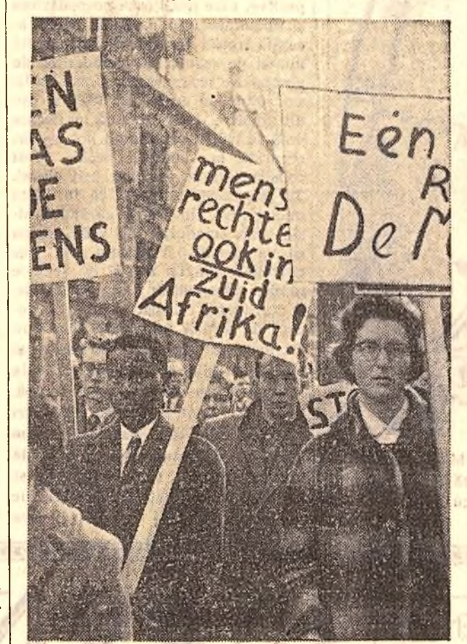
Haga (Olanda). Demonstrație de protest împotriva represiunilor rasiste din Uniunea Sudafricană.

Agencia France Presse relatează că la 8 aprilie Francois Erasmus, ministrul de Justiție al Uniunii Sudafricane, a anunțat în fața parlamentului că interzicerea activității „Congresului național african” și a „Congresului pan-african” proclamată de guvernatorul general va fi menținută pînă la 6 aprilie 1961.