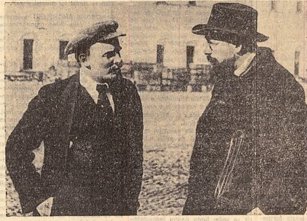
V. I. Lenin și V. Bonci-Bruevici în curtea Kremlinului în octombrie 1918.