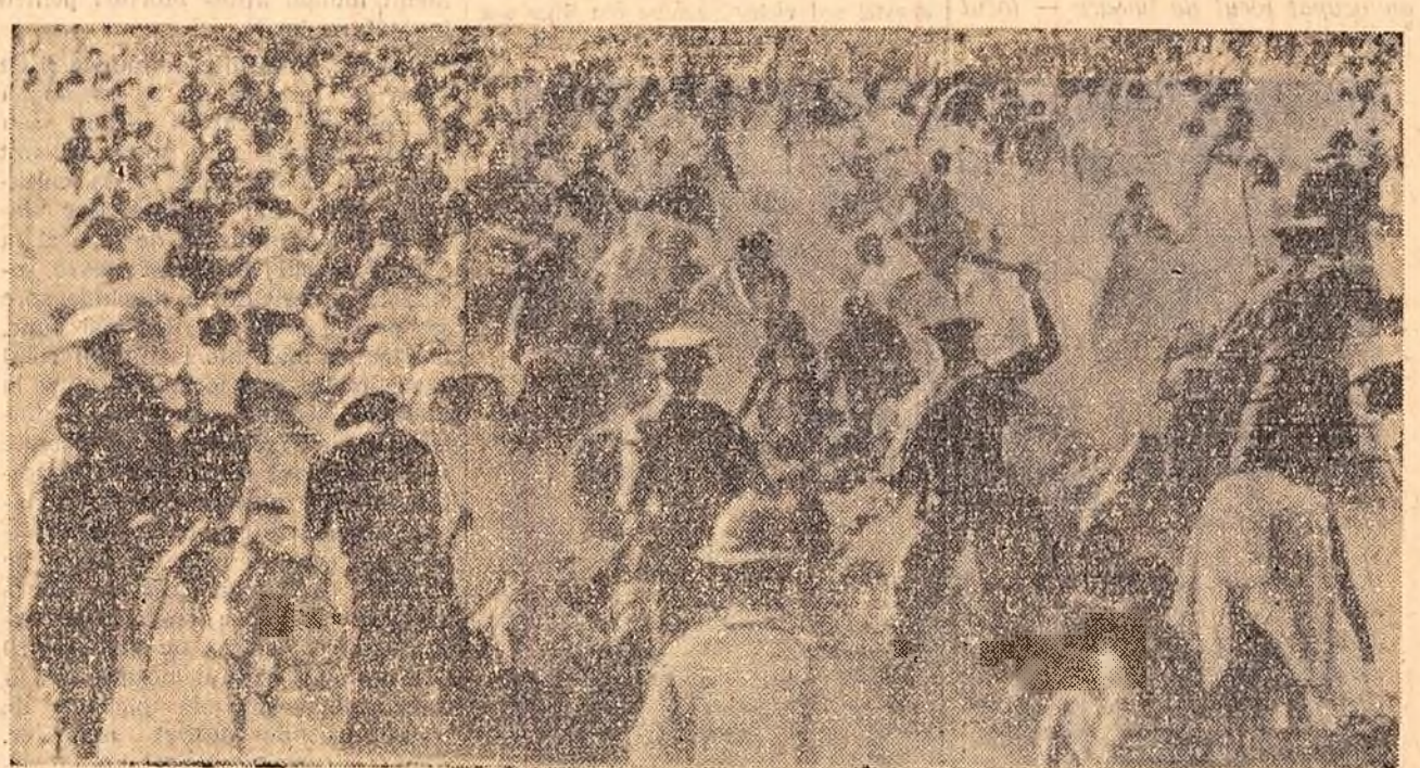
În timpul recentelor incidente din Uniunea Sudafricană de mai sus constituie un document grăitor al metodelor sălbatic și care guvernul rasist din Africa de Sud încearcă să înabuze lupta pentru drepturi a populației de culoare.

agențiilor de presă relatează că la mitingul din Trafalgar Square au participat peste 100.000 de persoane. Acest miting, subliniază corespondenții, a fost cea mai mare demonstrație de masă din capitala Marii Britanii din ultimii ani. La miting au luat cuvîntul numeroși conducători ai mișcării împotriva înarmării nucleare din Anglia, care au cerut încetarea cursei înarmării nucleare și realizarea unui program de dezarmare generală și totală.