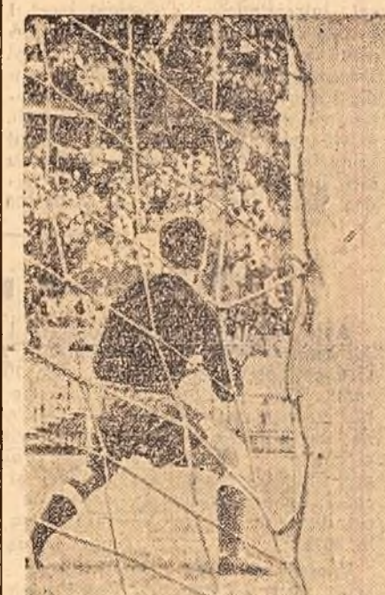
În meciul cu Farul, formația Rapid a condus cu 3-0, dar rezultatul final a fost de 3-3. Fotografia arată o fază la poarta echipei Farul. Scorul n-ajunseseră încă la 3-0... (În pag. III-a, rubrica sportivă...)

Chemarea a fost întîmpinată cu entuziasm de brigăzile utemiste de muncă patriotică din întreaga țară. (Agerpres)