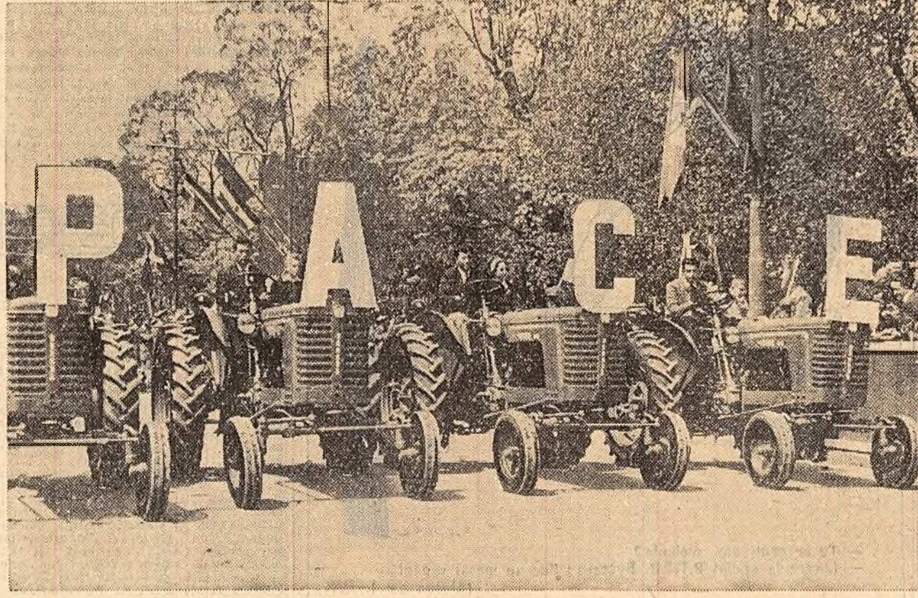
La demonstrația de 1 Mai, muncitorii din numeroase fabrici și uzine au prezentat produsele fabricilor lor, multe din ele ca machete și mostre purtate pe inginoase care alegorice. În fo-