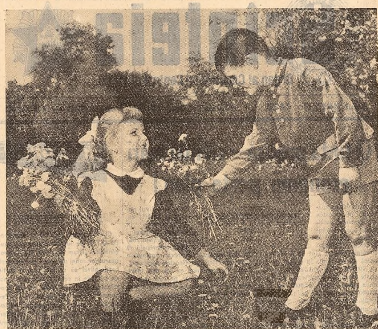
Flori de primăvară