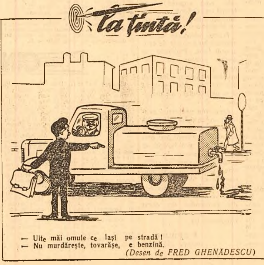
— Uite măi omule ce lași pe stradă! — Nu murdărește, tovarășe, e benzină. (Desen de FRED GHENADESCU)

Pe șantierul de construcții din Braia, în care se vor produce clorul și soda caustică. La secția de evaporare a leșilor cu început probele hidraulice, iar la secția de preparare a acidului clorhidric, proiectarea și execuția începe să se desfășoare.