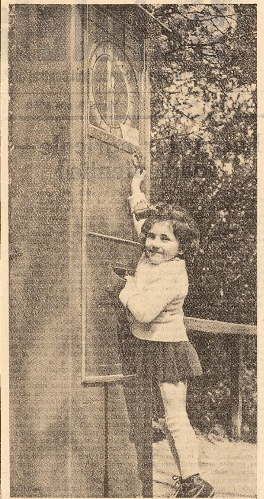
Cu greutatea stau bine, în înălțime trebuie să mai cresc!

În același timp au continuat lucrările de electrificare a satelor. De cîteva zile, lumina electrică a pătruns și în satele Sălcia, Segarcea Vele, Lița, Putineiu din raionul Tr. Magurele, Fusca — raionul Tîrn. Brezoanele — Răcari, lucrările continuînd în alte 7 sate. În 10 comune s-a extins rețeaua electrică. La Călărași s-au întreprins lucrări de îmbunătățire a alimentației cu apă, iar la Răscăneți s-au dat în folosință două săli de clasă, construite prin contribuția voluntară a locuitorilor.