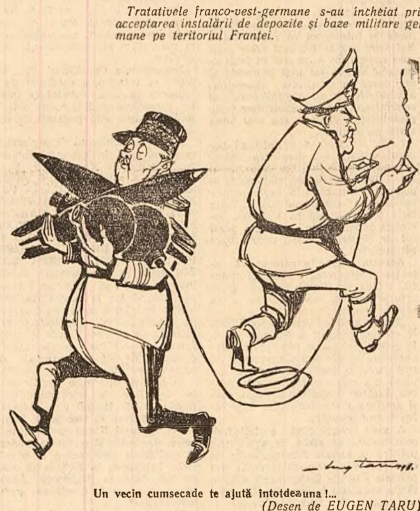
Un vecin cumsecade te ajută întotdeauna! (Desen de EUGEN TARU)