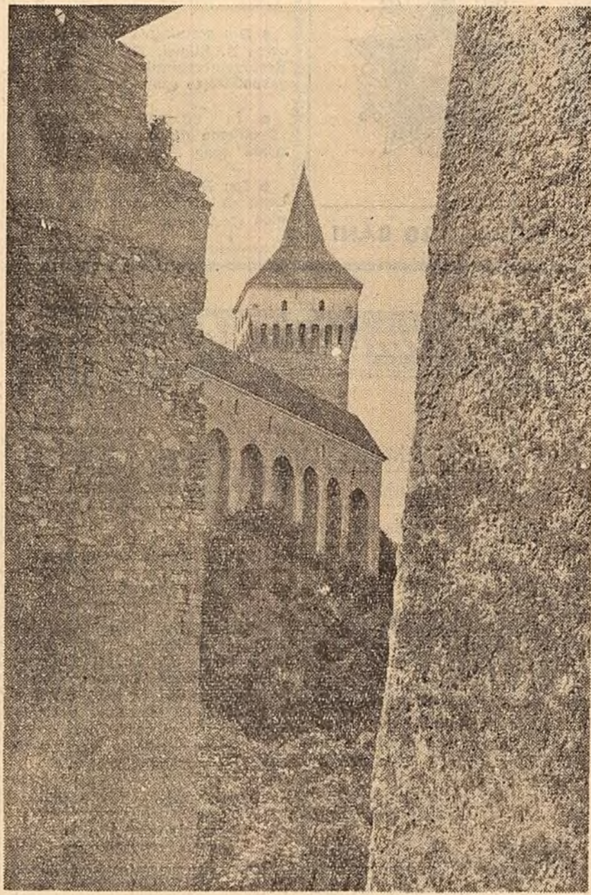
HUNEDOARA: Castelul Huniazilor.