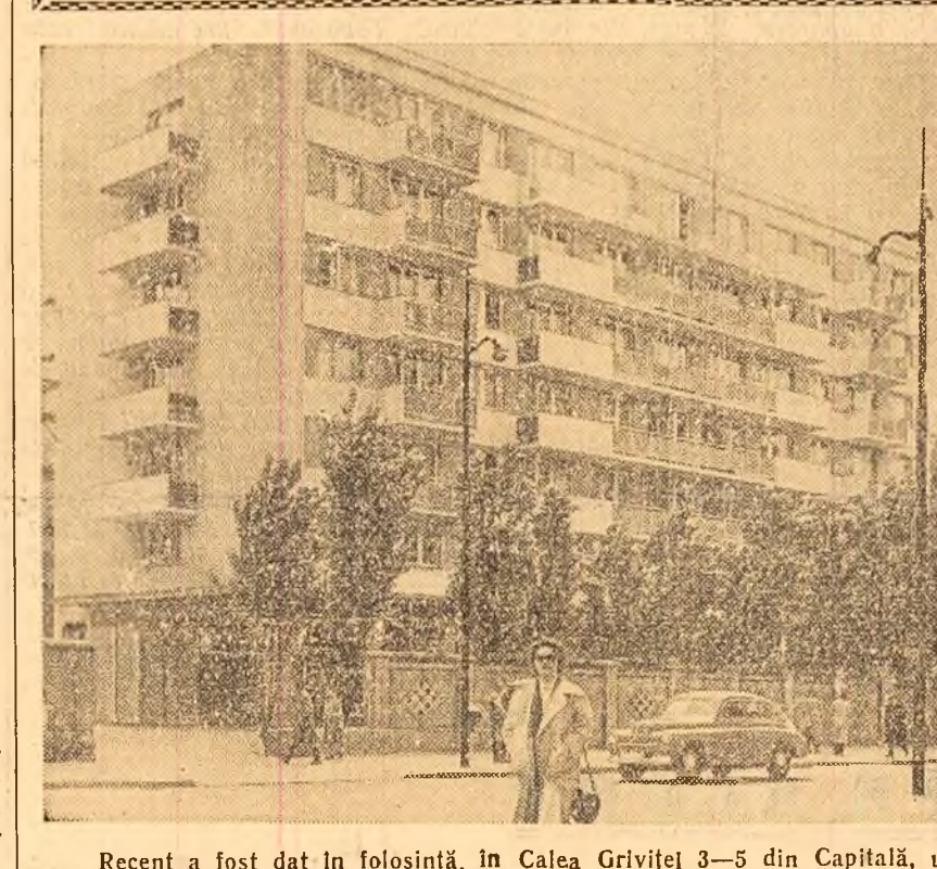
Recent a fost dat în folosință, în Calea Griviței 3-5 din Capitală, un nou bloc cu 54 apartamente.

Un rodnic schimb de experiență... La fabrica de încălziminte „Kirov” din Capitală a avut loc ieri un schimb de experiență la care au participat muncitorii din secțiile tăbăcărie și încălziminte.