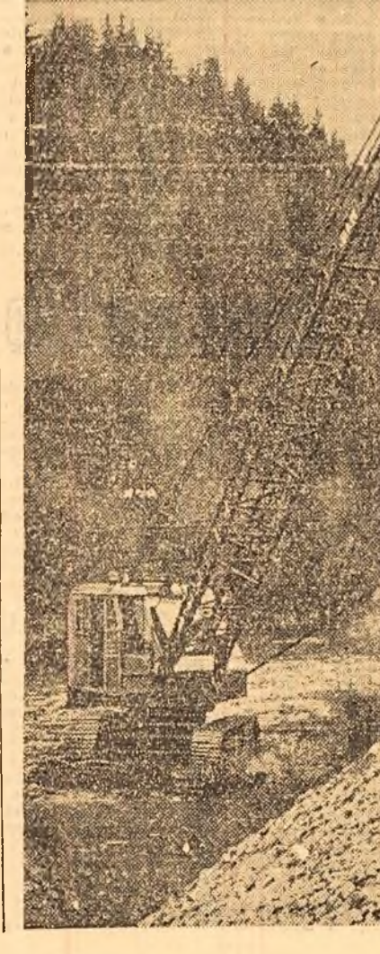
La modernizarea drumului Fălticeni-Suceava-Vatra Dornei, constructorii folosesc în acest an materialele lăptine din carierele deschise în apropierea punctelor de lucru.

O cinzeacă cu continuare... Pe șantier vin mulți tineri. Dintre ei sînt destui aceia care iau pentru prima oară legătura cu viața de muncă organizată, de colectiv.