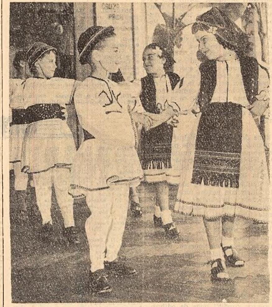
Sintem în plină repeliție. La 1 iunie avem serbare.

Imagina vechiului sat dobrogean, lipsit de vegetație, cu ulițe înguste în praful, cu garduri dăpănate și căsuțe acoperite cu pămînt începe să dispară. Luptînd pentru creșterea producției agricole, țărăni și animale, colectiviștii din regiunea Constanța participă cu însușelire și la modernizarea drumurilor, la buna gospodărire și înfrumusețarea a satelor regiunii. M. ROTARU coresp. „Scinteia”