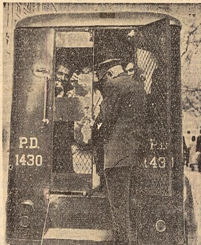
În ultima vreme în S.U.A. se desfășoară numeroase „exerciții de apărare pasivă”. În fotografie: Arestarea de către poliția newyorkeză a unor cetățeni care în timpul unor asemenea exerciții au refuzat să intre în adăposturi și au purtat pancarte pe care

a produs o mare impresie asupra asistenței. Sala de ședințe a Consiliului de Securitate se putea asemui cu o sală de tribunal în care se judeca un criminal internațional primejdios, care voia să pară un prunc nevinovat. Reprezentantul S. U. A., Lodge, care a luat cuvîntul după cuvîntarea lui Gromiko, a încercat într-adevăr să pară un prunc nevinovat. Lodge nu a prezentat nici un argument în apărarea zborurilor provocatoare ale avioanelor de spionaj americane deasupra teritoriului U.R.S.S. și totuși el a încercat să apere aceste zboruri și să le justifice. Cuvîntarea lui Lodge în Consiliul de Securitate, constată corespondentul „Pravdei”, a demonstrat că cererile influente de la Washington intenționează și de acum înainte să-și continue manevrele primejdioase pentru cauza păcii.