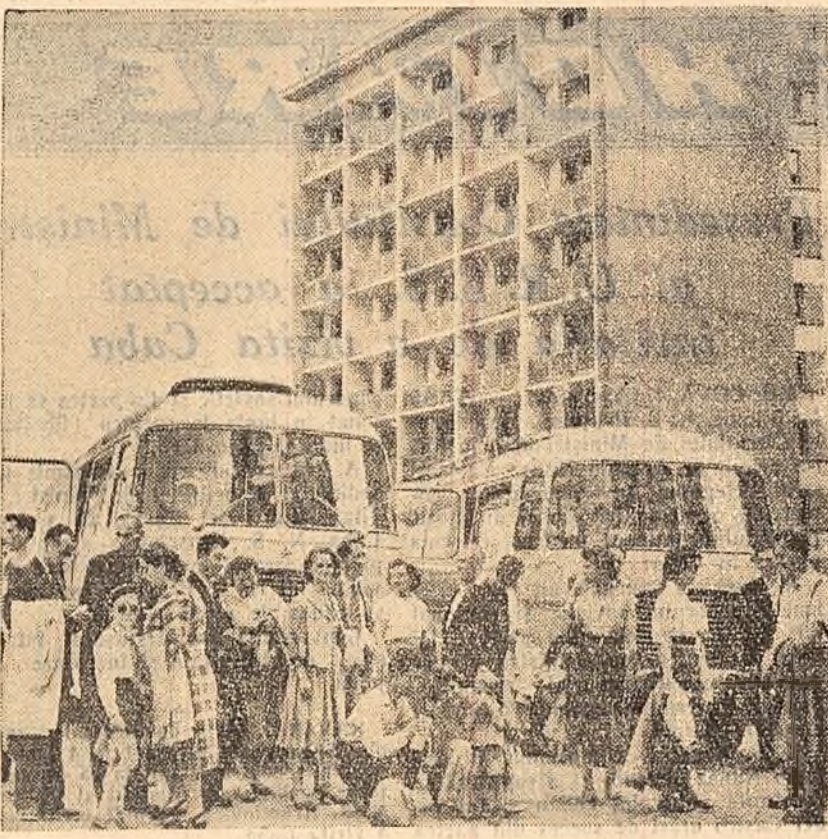
Numerosi oameni al muncii din Capitala au plecat ieri dupa-amiază în excursie cu autocarele O.N.T.-Carpați și cu trenuri speciale spre Sinaia, Coța 1400, Bran etc. Iată un grup de turiști înainte de plecare, în fața Agenției O.N.T.-Carpați.