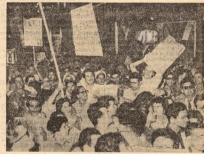
Demonstrație de protest la Havana (Cuba) împotriva acțiunilor agresive ale cercurilor reacționare din S.U.A.

Cuvîntarea lui Nixon constituie o nouă dovadă a faptului că acest protejat al monopolurilor, unul din președinții la președinție, vrea să pătrundă în Casa Albă pe mirtoaga șchioapă a „războiului rece”.