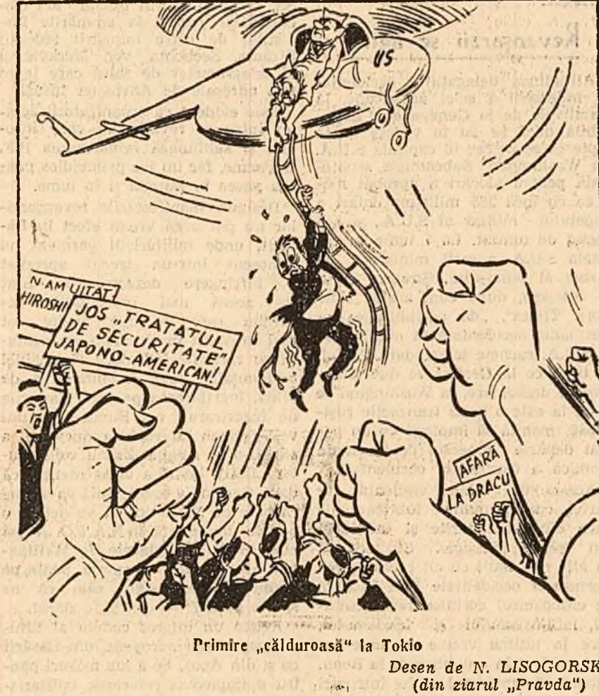
Primire „calduroasă” la Tokio

Imediat după sosirea știrilor care relatează că purtătorul de cuvînt al Casei Albe, James Hagerty, a fost atacat de o mulțime de zeci de mii de demonstrați anti-americani, un agent de asigurări a invitat președintele să se asigure împotriva furturilor și altor incidente. Polițele respective s-au încheiat foarte repede.