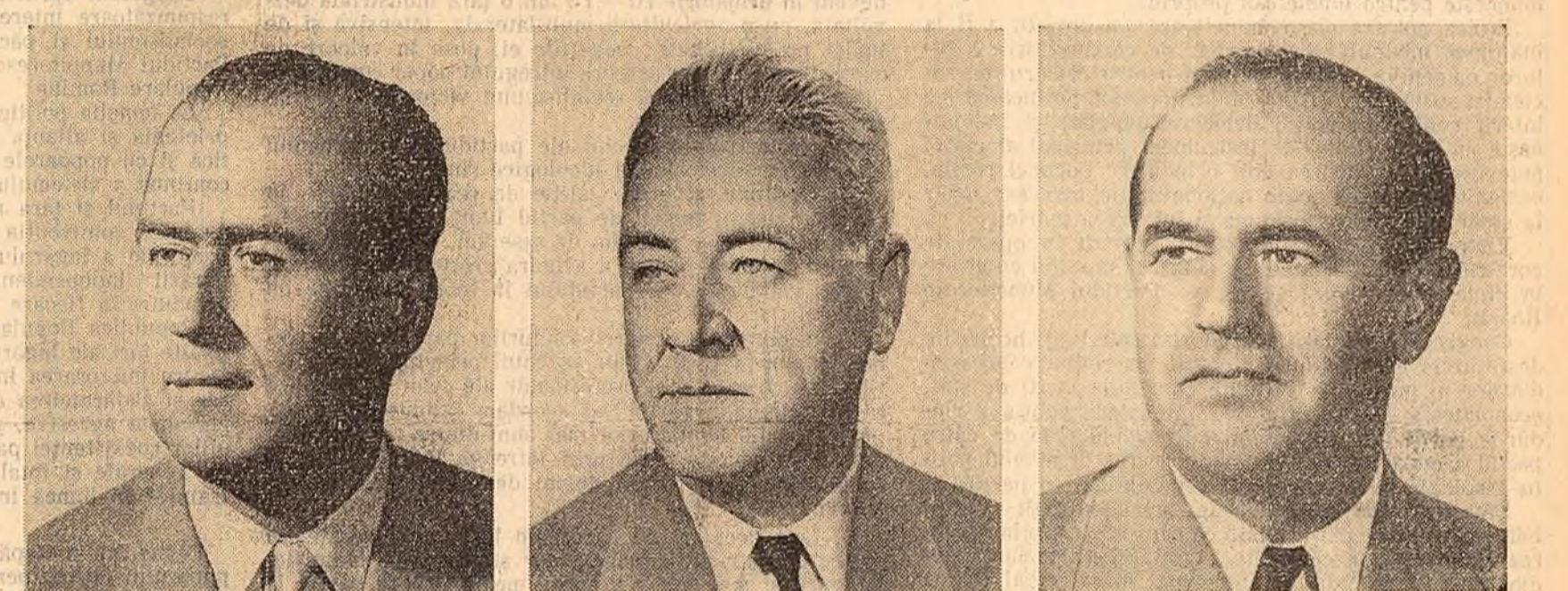
ALEXANDRU DRĂGHICI ION GHEORGHE MAURER ALEXANDRU MOGHIOROȘ