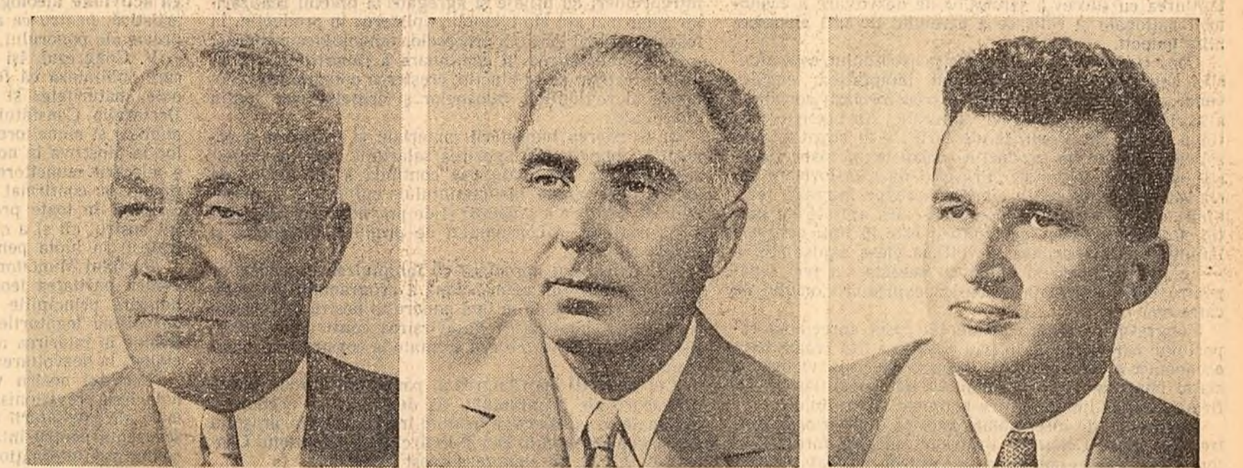
EMIL BODNARAȘ PETRE BORILA NICOLAE CEAUȘESCU