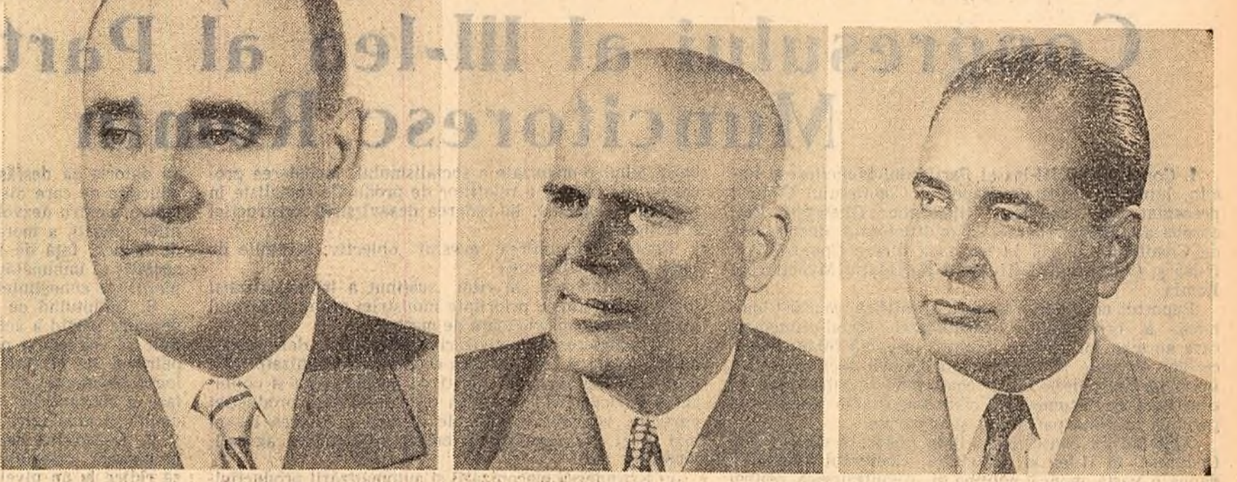
GHEORGHE GHEORGHIU-DEJ CHIVU STOICA GHEORGHE APOSTOL