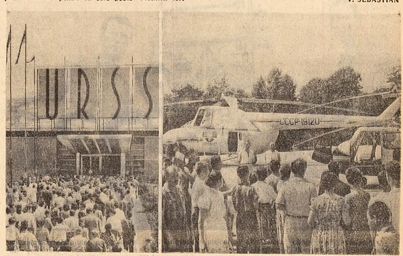
Aspecte de la Expoziția sovietică din Capitală. În fotografiile (stînga): Sute de cetățeni îndreptîndu-se spre localul expoziției, (dreapta): În fața platformei speciale, un grup de vizitatori admira pu-tomicele elicoptere sovietice.