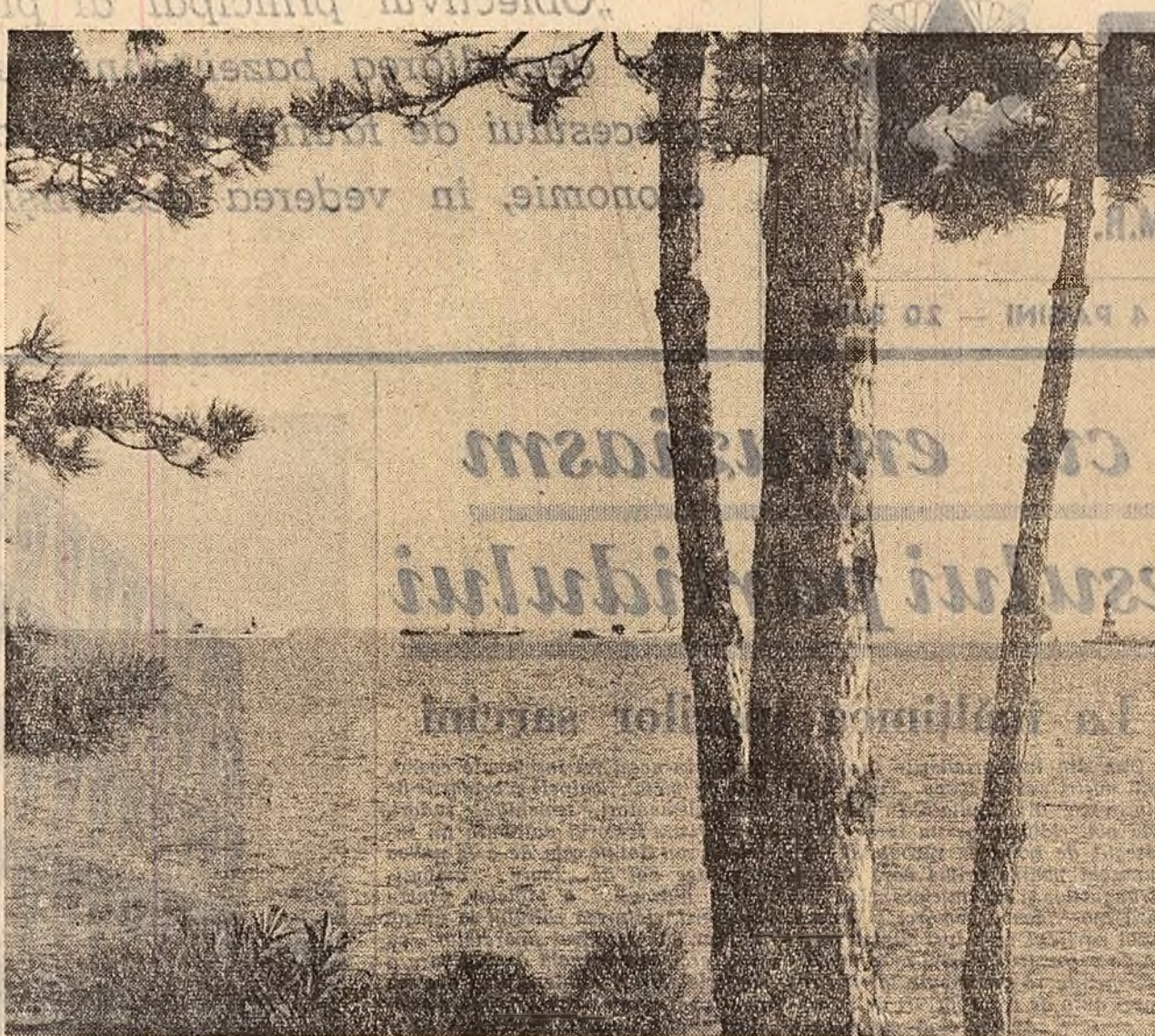
Constanța — vedere spre largul mării.