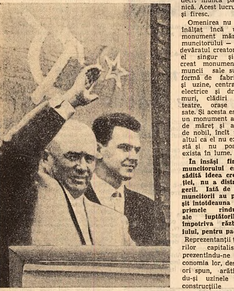
N. S. Hrușciov răspunzînd ovațiilor muncitorilor.

VIENA 1 (Agerpres). — TASS: Luind cuvîntul la Uzina de automobile din Viena, N. S. Hrușciov a spus printre altele: Noi am auzit și mai înainte de întreprinderea dv., cunoaștem producția ei. Autocamioanele frigorifice produse de dv. pot fi văzute în multe orașe ale Uniunii Sovietice.