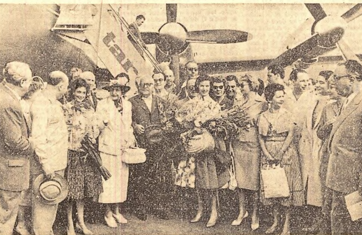
Pe aeroport, la sosirea colectivului teatrului „Vahtangov”

În regiunea Timișoara, în vederea recoltării grîului, au intrat în centrul atenției.