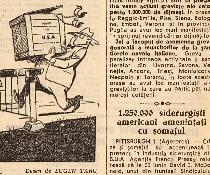
Desen de EUGEN TARU

Demascarea de către reprezentanții țării socialiste a manevrelor puterilor occidentale la tratativele de la Geneva în problema dezarmării a provocat o vie iritare în cercurile militariste din Statele Unite.