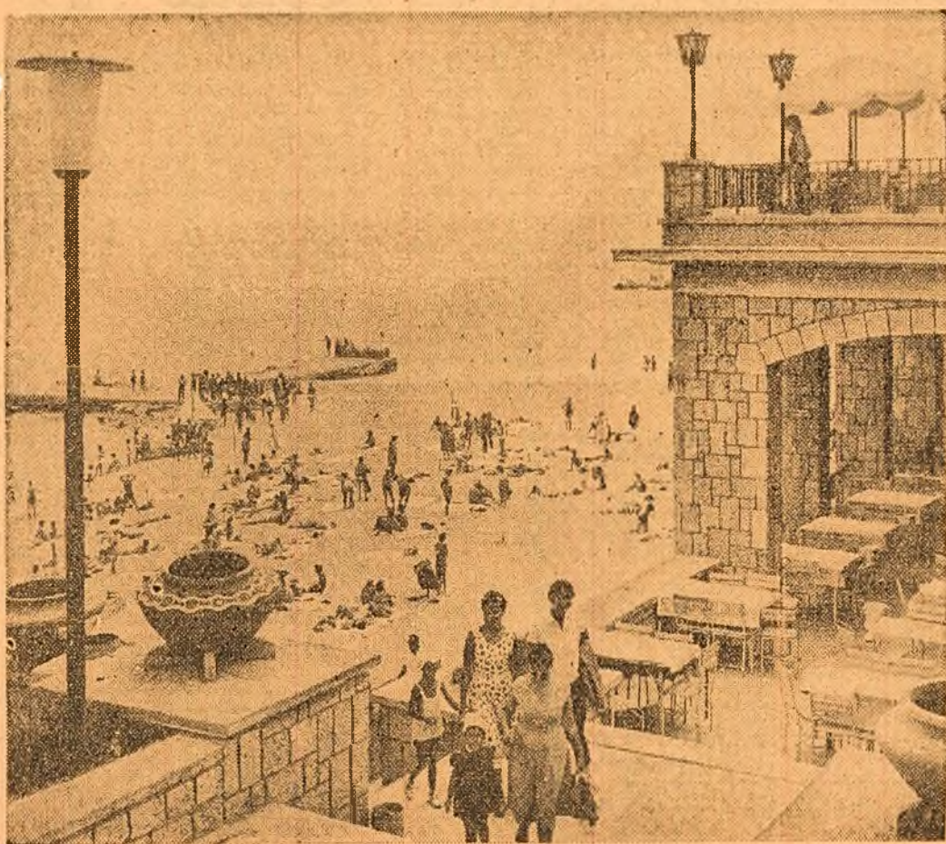
Pe litoralul Mării Negre — la Constanța, Mamaia, Eforie, Vasile Roaită, Mangalia — își petrec concediul de odihnă mii și mii de oameni ai muncii din toată țara. Ei sînt găzduși în vile și case confortabile.

În prezent se analizează datele măsurătorilor și ale observațiilor.