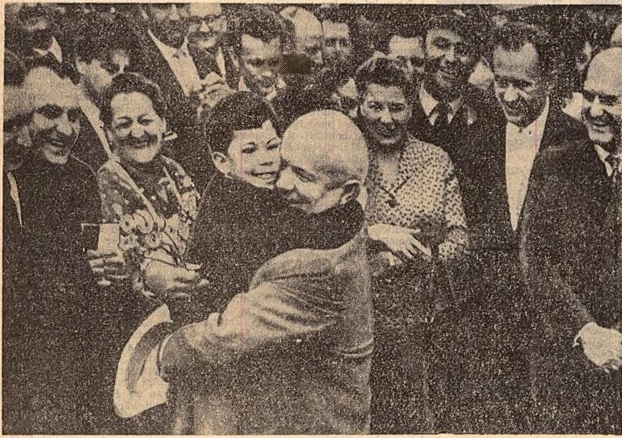
Lângă Salzburg, ca pe întregul parcurs, oaspeții sovietici sînt salutați cu căldură de populație.

VIENA 6 (De la trimișul nostru special). După vizitarea hidrocentralei de la Kaprun, delegația sovietică și-a continuat drumul spre Carinthia. Plecarea de la Kaprun a fost marcată de un moment emoționant prilejuit de convorbirea lui N. S. Hrușciiov cu inginerul Viktor Pumphel, care în timpul războiului a lucrat ca inginer civil la postul de radio Minsk. Aici a văzut într-o zi un grup de SS-iști, spinzărind un bust al lui Lenin. Am așteptat ca hoarda să se îndepărteze, a spus inginerul Pumphel, și apoi am ascuns bustul. Când s-a sfîrșit războiul l-am adus acasă ca pe o amintire scumpă. Dați-mi voie, Nikita Sergheevici, să vi-l ofer eu.