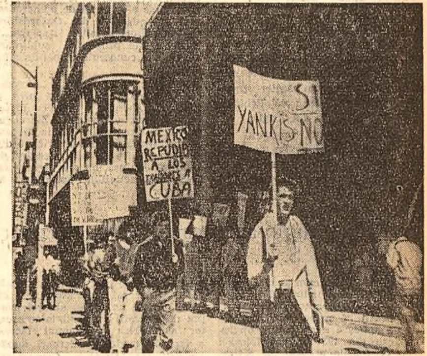
O demonstrație a tineretului la Mexico City în sprijinul luptei drepte a poporului cuban.

pentru apărarea CUBEI. Sub lozincile „Yanki, jos minile de pe Cuba !”, „Nu vă atingeți de Cuba !”, „Pentru Cuba - da, pentru Yanki - nu !” la Montevideo a avut loc o demonstrație de masă. MEXICO CITY 14 (Agerpres). - Într-o declarație publicată în „Ultimele Noticias” Comitetul executiv național al Partidului popular condamnă amestecul S.U.A. în treburile interne ale CUBEI și își exprimă solidaritatea cu poporul cuban. „Este necesar, se spune în declarație, ca poporul mexican să-și dubleze sprijinul acordat poporului Cubei care se afiă într-o primejdie serioasă. Aceasta este nu numai datoria noastră imperioasă, dar și o necesitate urgentă...”