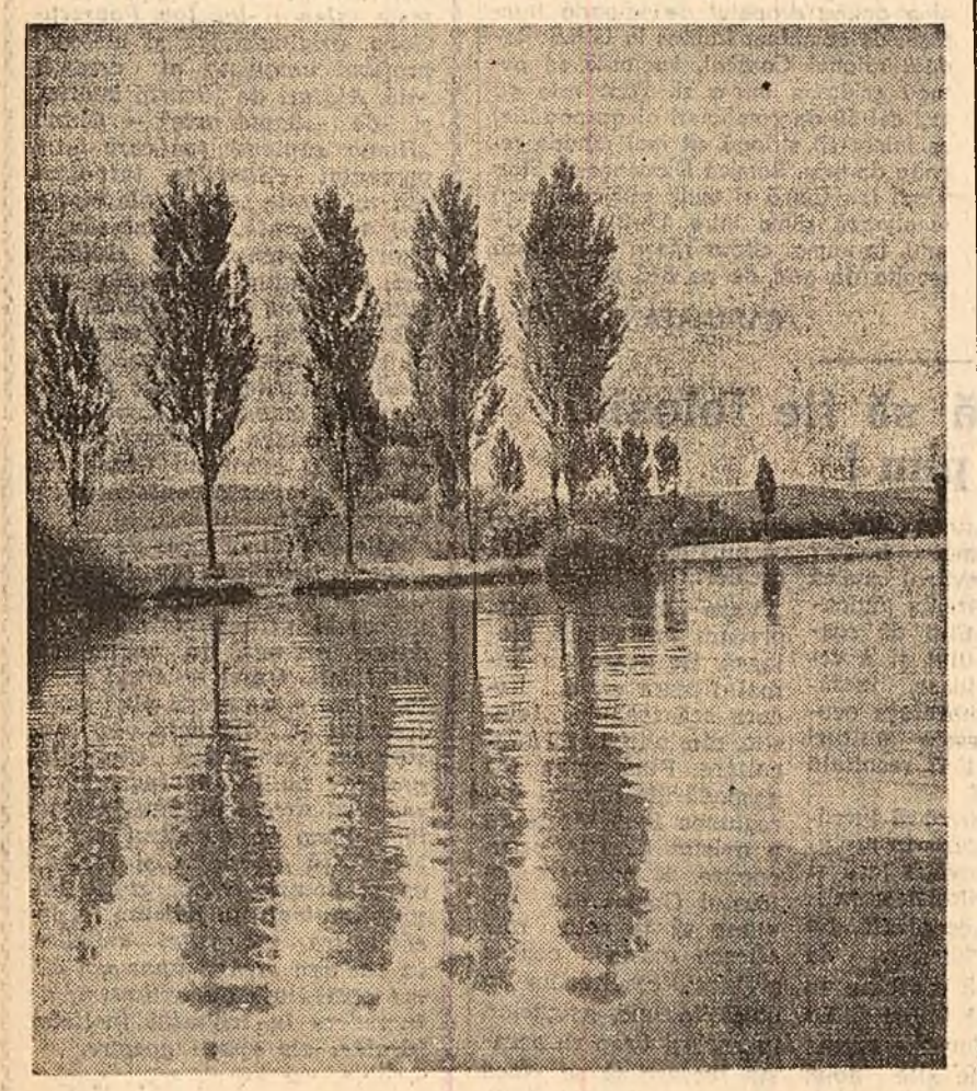
Pe Valea Mureșului

Începînd de azi 15 Iulie, din cauza unor lucrări edilitare, traseul liniei de autobuze nr. 32 se deviază pe ambele sensuri, între parcul G. Coșbuc și strada Antim prin bulevardul Coșbuc — strada Justiției, apoi în continuare pe traseul normal.