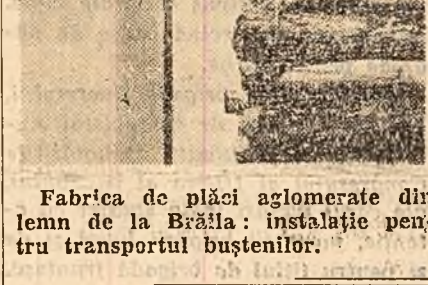
Fabrica de plăci aglomerate din lemn de la Brăila: instalație pentru transportul buștenilor.