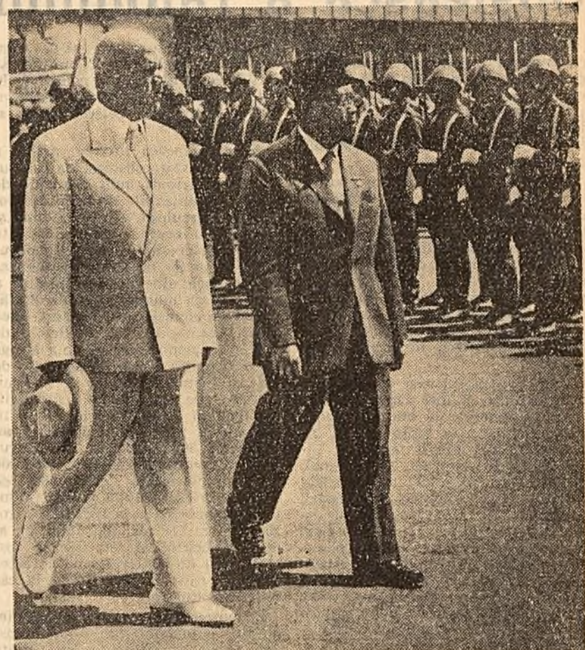
Ministrul-prim al Indoneziei, Djuanda și președintele Consiliului de Miniștri al R.P. Romine, Chivu Stoica, trec în revistă garda de onoare.