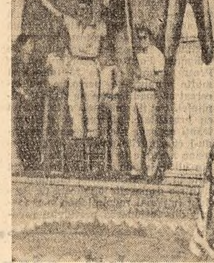
Studenții de la universitatea din Nicaragua la o demonstrație de protest împotriva amestecului S.U.A. în treburile interne ale țărilor din America Latină. Ei au spulșurat un manechin simbolizând pe ambasadorul S.U.A. și au călcat în picioare drapelul S.U.A.

NEW YORK 23 (Agerpres). - După cum anunță corespondentul agenției United Press Internațional, de la baza forțelor aeriene militare de la Vandenberg (California) comandamentul forțelor aeriene militare a comunicat că racheta balistică intercontinentală