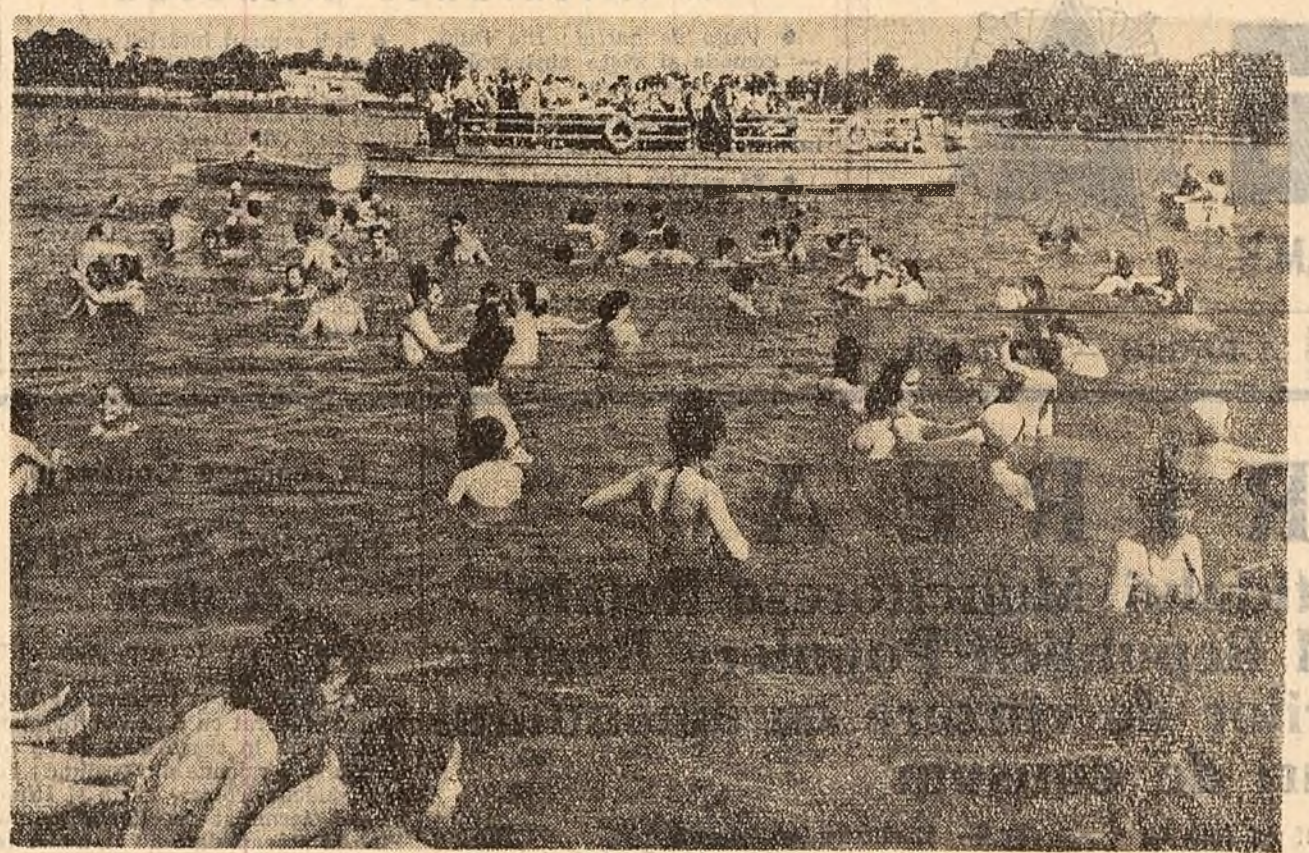
La lacul Tei, în aceste zile călduroase.