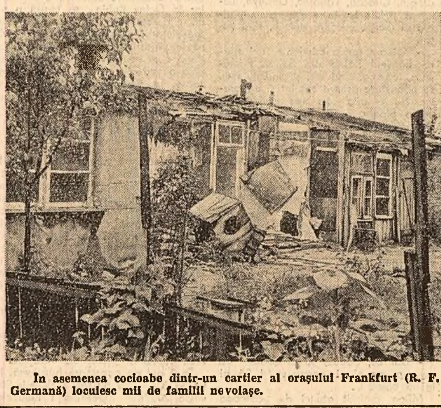
În asemenea cocloabe dintr-un carier al orașului Frankfurt (R. F. Germană) locuiesc mii de familii nevoiașe.

ROMA 26 (Agerpres). — Agenția France Presse anunță că Amintore Fanfani (democrat-creștin), care a acceptat să formeze noul guvern italian, a prezentat în seara zilei de 26 iulie lui Giovanni Gronchi, președintele Republicii, lista noului guvern.