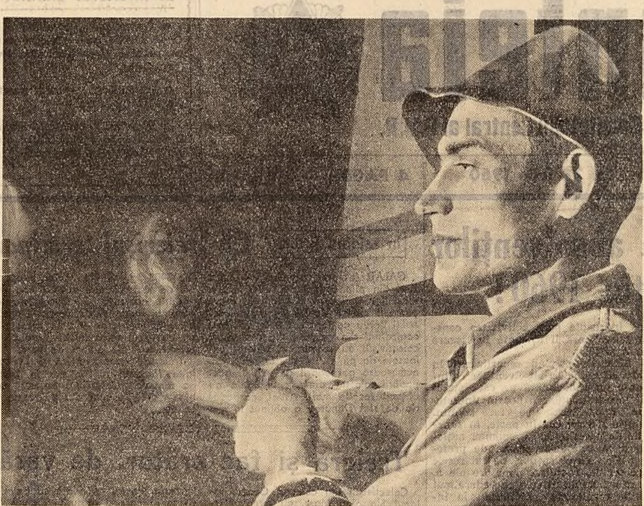
CUPTORARUL (De la expoziția de fotografii artistice „Patria noastră în plin avînt”)

De curînd au început la Iași lucrările de restaurare a universității „Al. I. Cuza”, valoros monument istoric. Restaurarea are drept scop refacerea edificiului într-un stil cât mai apropiat de cel original. Zidurile exterioare vor fi consolidate, iar o serie de piese de piatră ornamentale de la fațada principală a clădirii vor fi completate.