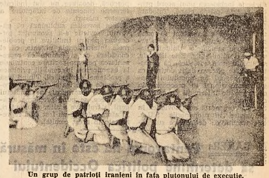
Un grup de patrioți iranieni în fața plutonului de execuție.

PARIS 27 (Agerpres). — Continuînd ciclul de articole referitoare la Iran, revista „France Observateur” scrie că „Iranul este regatul terorii și represiunilor polițienești”. În decurs de șapte ani „Cavaka” — siguranța iraniană — a cercetat peste 200.000 de cazuri, a trimis în închisori peste 11.000 de persoane și a executat 4.000 de iranieni.