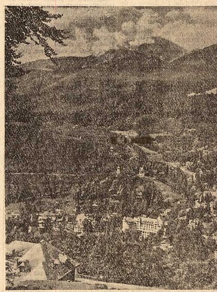
Frumusețea patriei: Vedere din Bușteni