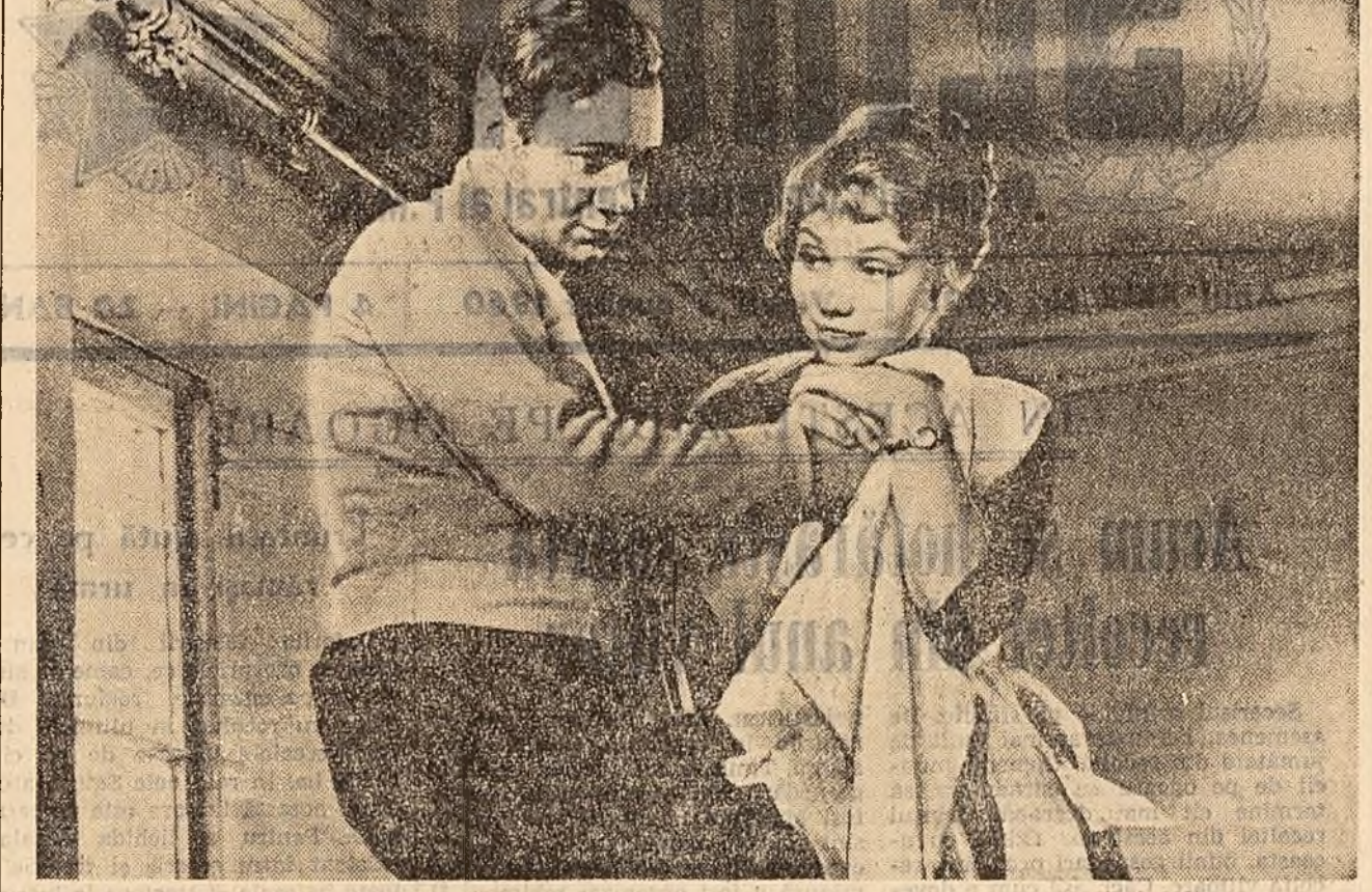
„Povestea tinerilor căsătorii” — noua producție a studioului sovietic „Lenfilm” care rulează pe ecranele cinematografulor bucureștene...