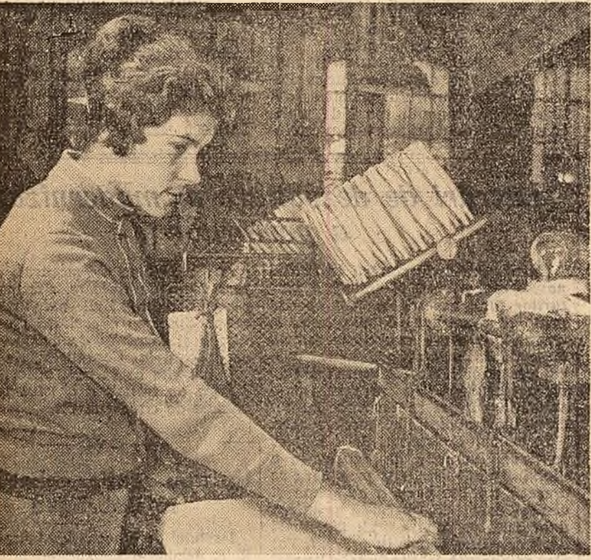
Tinerii de la întreprinderea „Jesătoria Reunite” din Capitală întinplă Congresul U.T.M. ca realizări deosebite în muncă...