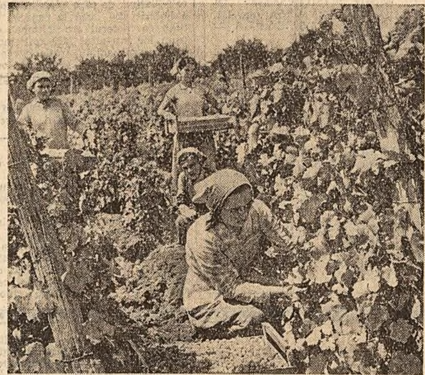
La cules de struguri