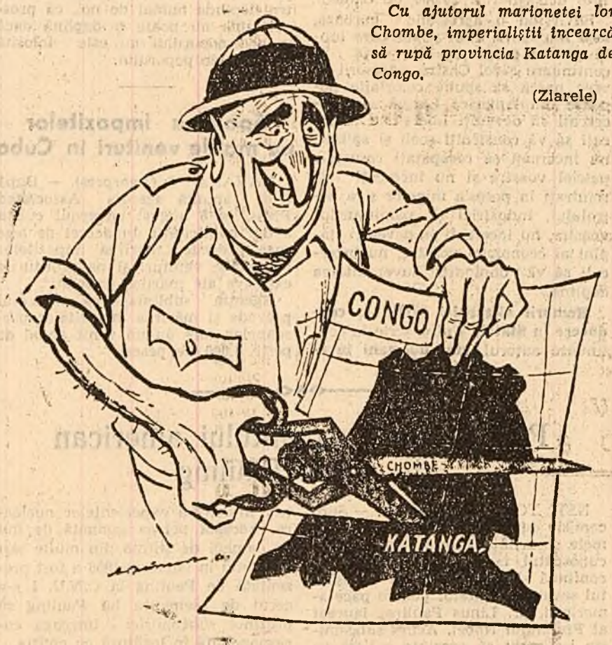
Cu ajutorul marionetei lor Chombe, imperialistii incearca sa rupă provincia Katanga de Congo. (Ziarele)

Hamarskjoeld considera ca Consiliul de Securitate nu poate schimba caracterul fortelor armate speciale ale O.N.U. si de fapt propune sa se caute alte cai pentru atingerea scopului propus de Consiliul de Securitate - evacuarea trupelor belgiene de pe intregul teritoriu al Congoului.