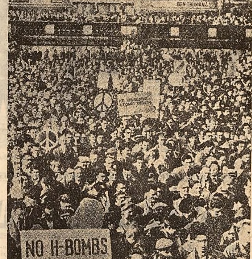
La Londra, ziua Hiroshimei a fost marcata prin organizarea de catre studentii englezi a unor pichete in fata sediului oficiale al primului ministru Macmillan. Demonstranti au tinut primul ministru o peticie prin care cer dezarmarea nucleara unilaterala a Angliei.