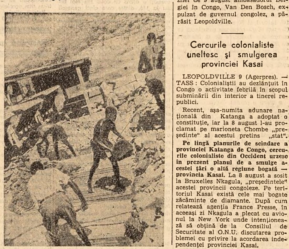
In loc de mașini - munca manuală a negrilor e mult mai ieftină. Salariul - de zeci de ori mai mic decât al albilor. Așa se poate explica...