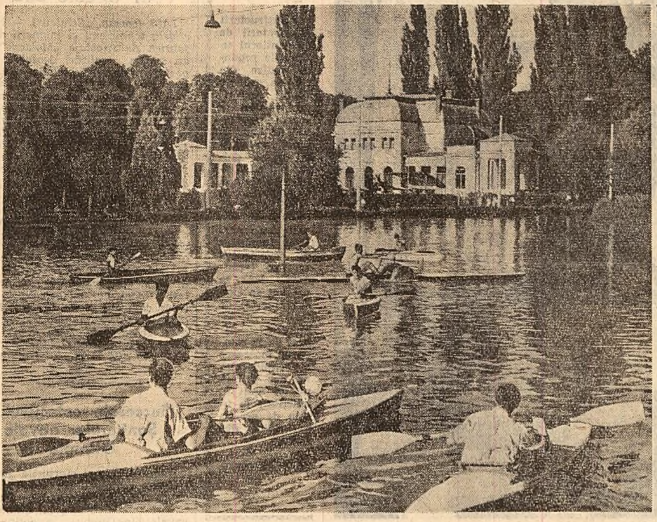
In parcul oraşului Cluj