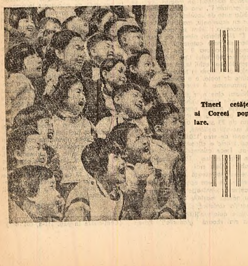
Tineri cetățeni ai Coreei populare.