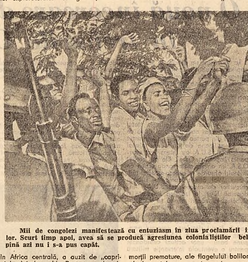
Mii de congolezi manifestează cu entuziasm în ziua proclamării independenței țării lor. Seurt timp apoi, avea să se producă agrestunea coloniștilor belgieni căreia nici un african nu i s-a pus capăt.

LONDRA 16 (Agerpres). — Ziarele britanice au anunțat că zilele acestea Confederația sindicatelor muncitorilor din industria navală și constructorilor de mașini — organizație sindicală care grupează peste 3.000.000 de oameni ai muncii din Marea Britanie — a prezentat revendicări de sporire a salariilor.