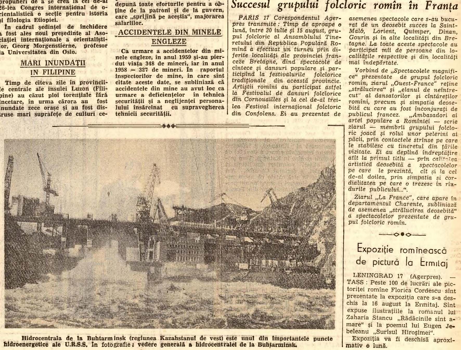
Hidrocentrala de la Buhtarminsk (regiunea Kazahstanului de vest) este unul din importantele puncte hidroenergetice ale U.R.S.S. În fotografie: vedere generală a hidrocentralii de la Buhtarminsk.

PARIS 17 Corespondentul Agerpres transmite: Timp de aproape o lună, între 20 iulie și 15 august, grupul folcloric al Ansamblului Tineretului din Republica Populară Romînă a efectuat un turneu prin diferite localități ale provinciei franceze Bretagne, dînd spectacole de cîntece și dansuri populare și participînd la festivalurile folclorice tradiționale din această provincie.