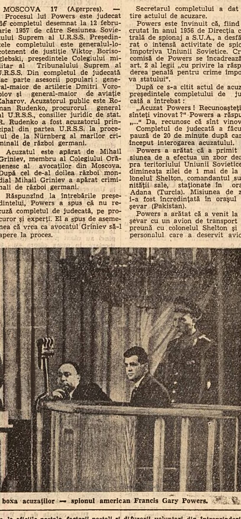
Aspect din sala procesului. În boxa acuzărilor — spionul american Francis Gary Powers.

REDACȚIA ȘI ADMINISTRAȚIA București, Piața „Scintei”, Tel. 17.60.10, 17.60.40, 17.61.00. Abonamentele se fac la oficiile poștale, factorii poștali și difuzorii voluntari din întreprinderi și instituții. Tiparul: Combinatul Poligrafic Casa Școltei „I. V. Stalin”