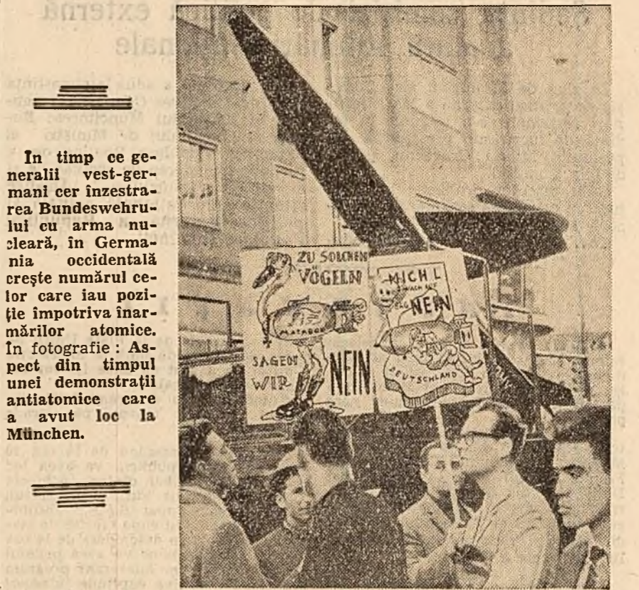
În timp ce generalii vest-germani cer înzestrarea Bundeswehrului cu arma nucleară, în Germania occidentală crește numărul celor care iau poziție împotriva înarmării atomice. În fotografie: Aspect din timpul unei demonstrații antiatomice care a avut loc la München.

HANOI 27 (Agerpres). — Două avioane neidentificate au tras asupra fluviului Mekong, de-a lungul căruia trece frontiera dintre Laos și Tailanda. Acest incident a avut loc la 26 august și, după cum s-a mai anunțat cu o zi înainte, o salupă de pază a Tailandei a deschis focul asupra unei patruli laoțiene în imediata apropiere a orașului Vientiane. Este semnificativ faptul că provocările militare împotriva Laosului coincid în timp cu conferința blocului agresiv al S.E.A.T.O. care a început la 26 august în capitala Tailandei, Bangkok.