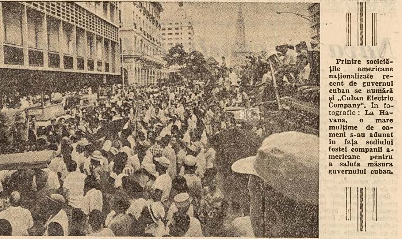
Printre societățile americane naționalizate recent de guvernul cuban se numără și "Cuban Electric Company". În fotografie: La Havana, o mare mulțime de oameni s-au adunat în fața sediului fostei companii americane pentru a saluta măsura guvernului cuban.

Comentând în același fel memorandumul comandamentului Bundeswehrului, ziarul "Deutsche Volkszeitung" subliniază că anumite prevederi "sint, de la un capăt la altul, citate din arhiva politică a național-socialiștilor" și sint menite să servească drept "bază moral-politică pentru cererile militare lipsite de simțul răspunderii avînd ca scop să asigure nu numai înarmarea atomică nelimitată a Bundeswehrului, dar și pregătirea populației în vederea participării în masă la un nou război".