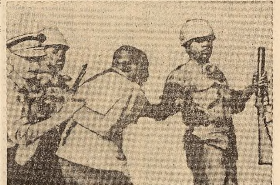
La aeroportul din Elisabethville, capitala provinciei Katanga, a avut loc o demonstrație de solidaritate a populației din Katanga cu guvernul central al Republicii Congo. Mercenarii lui Chombe au imprăștiat cu săbâție pe demonstranți, folosind gaze lacrimogene. Au fost arestați circa 100 de persoane. În fotografie: soldați din trupele marionetei Chombe și un ofițer belgian arestind pe un participant la demonstrație.

VIENTIANE 27 (Agerpres). — Eforturile primului ministru al Laosului, Suvanna Fomma, de a pune capăt stării încordate din țară se lovesc de împotrivirea crescândă a generalului Nosavan, partizanul Statelor Unite. Nosavan a respins cererea cu privire la retragerea subunităților sale din regiunea situată la 80 km. de Vientiane — capitala Laosului — spre care înaintează rebelii.