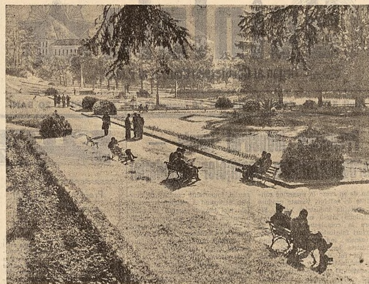
În amurg, prin parcul frumos al stațiunii Sîlcuțel Moldovel.