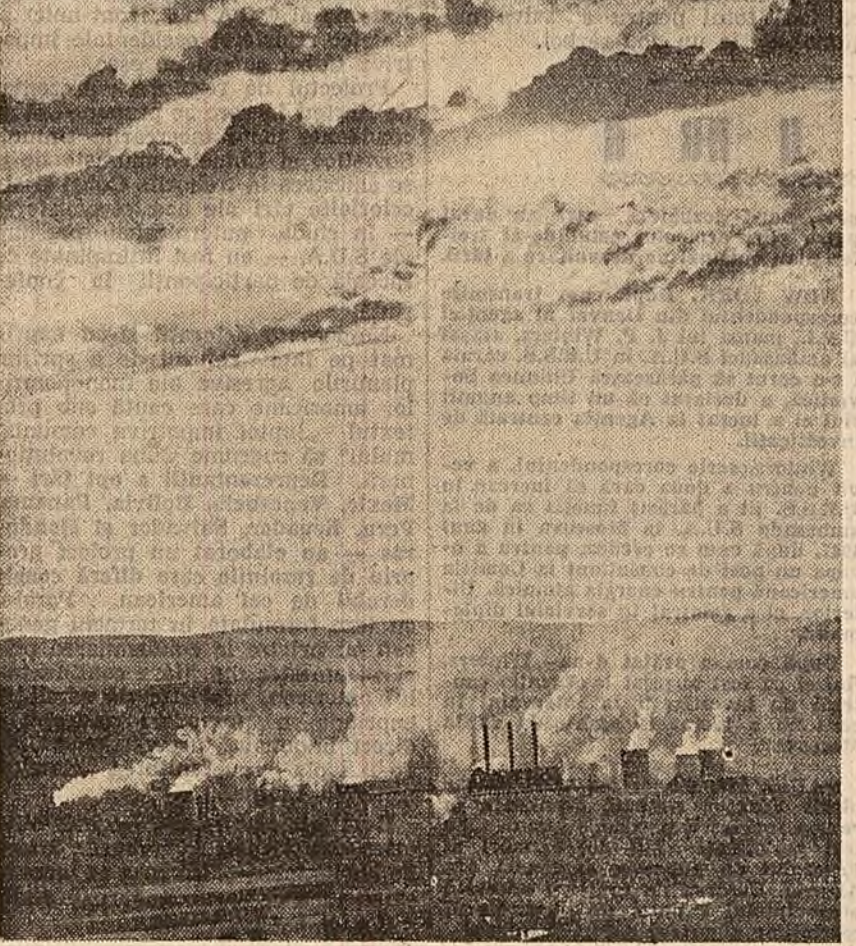
Panoramă hunedoreană.

HOCHEI PE IARBA Între România și Danemarca 10-0; Belgia-Elefanta 4-2; Noua Zeelandă-Olanda 1-1.