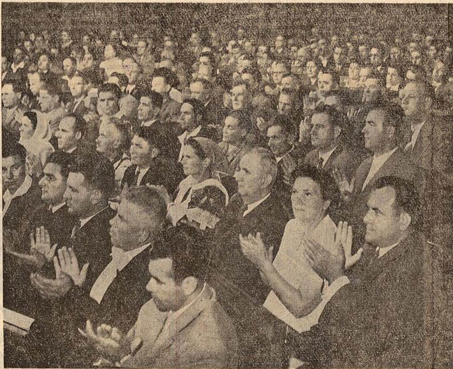
În sala Marii Adunări Naționale

Îmi exprim convingerea că dezbaterile problemelor situației internaționale și a politicii externe a Republicii Populare Romîne de către Marea Adunare Națională va fi o nouă și puternică manifestare a hotărîrii poporului nostru de a-și aduce contribuția la triumful principiilor coexistenței pașnice, la dezvoltarea colaborării între toate țările, la consolidarea păcii în întreaga lume. (Aplauze puternice, îndelung repetate. Asistența se ridică în picioare).