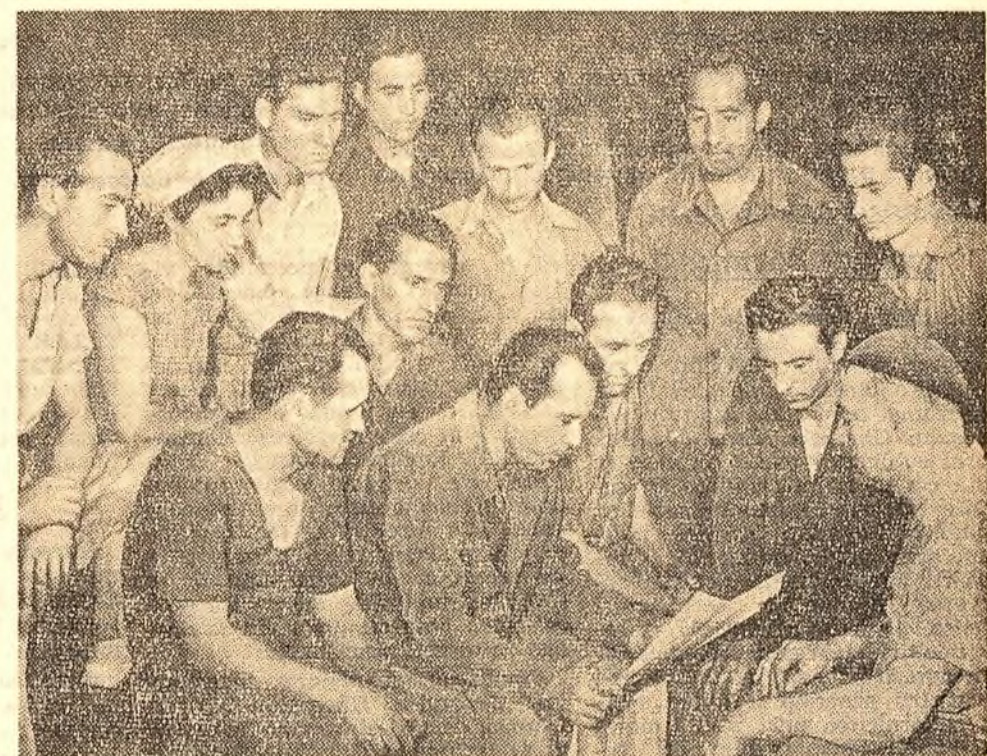
În pauza de dimineață, la uzinele „Timpurii Noi“. Adunați în jurul agitatorilor, muncitorii ascultă cu viu interes textul raportului tovarășului Gheorghiu-Dej.

Oamenii muncii romîni și maghiari din regiunea Cluj au luat cunoștință cu satisfacție și deosebit interes de Raportul prezentat de tovarășul Gheorghe Gheorghiu-Dej la sesiunea extraordinară a Marii Adunări Naționale.