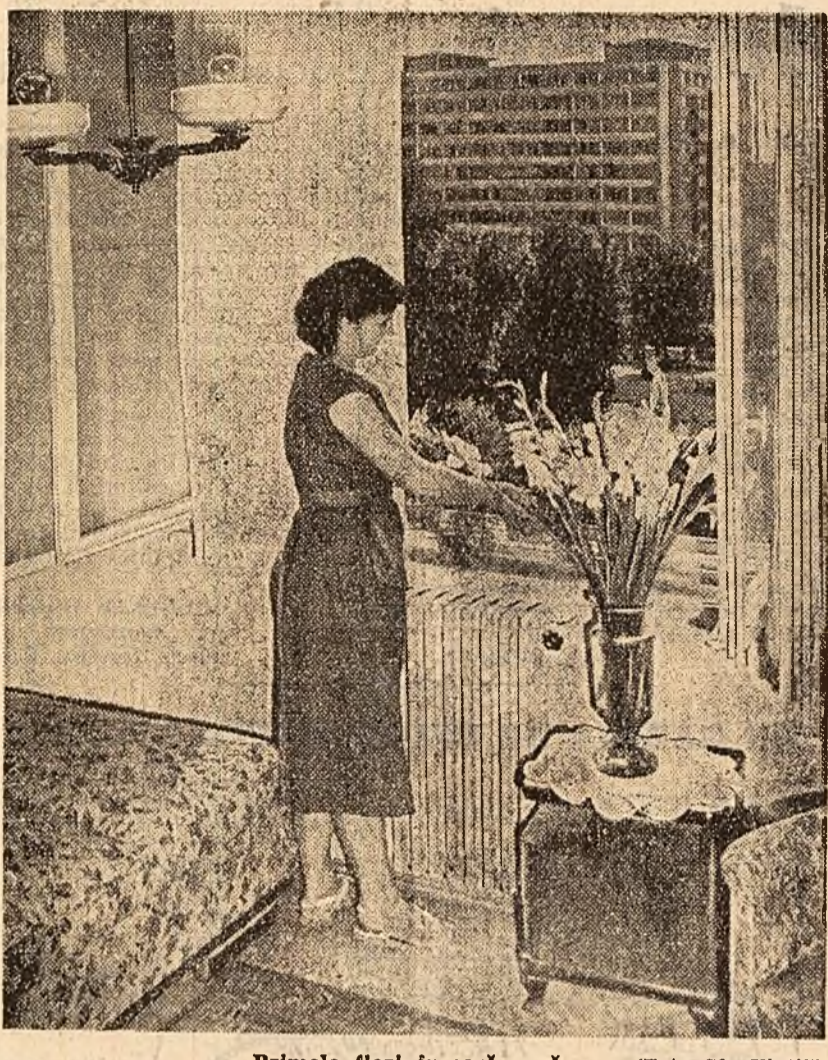
Primele flori în casă nouă.