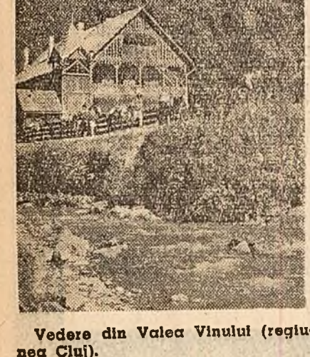
Vedere din Valea Vinului (regiunea Cluj).