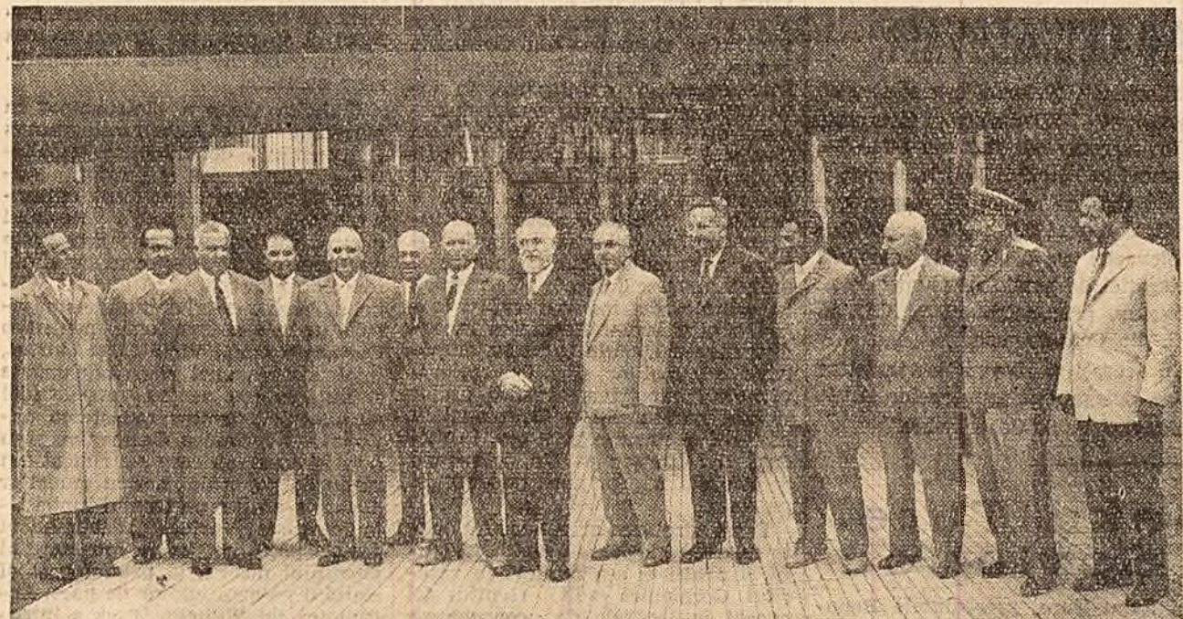
In gara Băneasa, înainte de plecare

În ziua de 7 septembrie a părăsit Capitala delegația Republicii Populare Române la cea de-a 15-a sesiune a Adunării Generale a Organizației Națiunilor Unite.