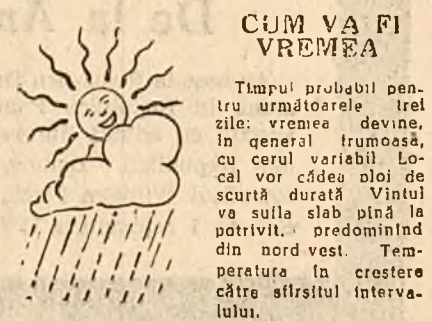
CUM VA FI VREMEA

JOI, 8 SEPTEMBRIE • Sută din baletul „Pavăla” de Viorel Dobos — orele 9.05 — I • Muzică populară românească — orele 11.05 — I • Program omel de studiu regional Timișoara — orele 14.00 — I • Muzică din opere, interpretată de soliști romîni — orele 16.30 — II • Săptămîna muzicii bulgare — orele 18.05 — II • Muzică ucraină de Petru Petruscu și Marius Mihail — orele 18.30 — I • Tribuna Radiu — orele 19.05 — I • Concertul nr. 1 la R. M. major pentru vioară al orchestrei de Papania solo: Zino Francescotti — orele 19.31 — II • Val; suri de concert — orele 19.45 — II • Din muzica populară — orele 19.45 — II • Sim; tonia „Romanica” de T. V. — orele 20.00 — I • Lucrări de Artă, prezentate cu — orele 21.15 — I • Lucrări muzic; romînești — orele 21.45 — I • Muzică de cameră — orele 22.24 — II