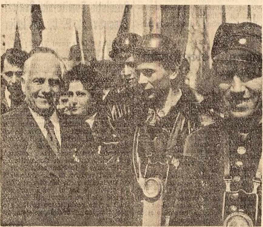
Wilhelm Pieck în mijlocul minerilor.

de 49 — trec într-una pe lîngă ea. Înălțimea de 1,81 m. o trece din a doua încercare. Fiecare moment al pregătirii ei pentru săritură este notat de zăriști. Stăcheta — la 1,85 m. Spectatorii au acceptat-o de acum pe Iolanda ca pe marea personalitate a acestor întreceri. Deși doboară de două ori, ei așteaptă și a treia încercare și sînt pumnii strînși pentru Ioli. În tribune, pe stadion — înșeie perfectă. Gițoia pași, o „bătăie” — mai îndărită — și trece înălțimea în uralele celor din tribune, care, în plictoare, scandează: bravo Iolanda, bravo România.