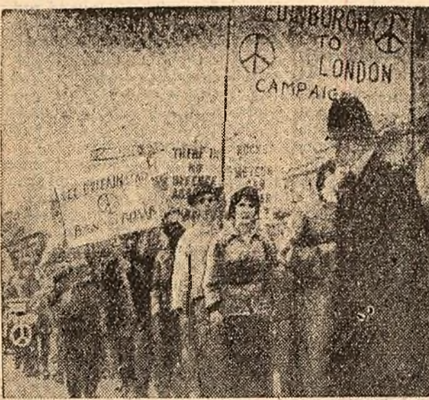
Marșul început zilele trecute în Anglia în semn de protest împotriva înarmării nucleare este în plină desfășurare pe o distanță de 400 de mile, între Edinburg și Londra, unde se va încheia la 24 septembrie printr-un mare miting în plaja Trafaigar.

CARACI. În Pakistanul de vest s-a înregistrat 5.000 de cazuri de holeră. Pînă acum au murit 700 de oameni.