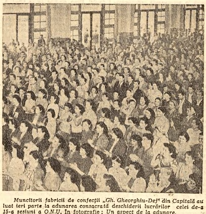
Muncitorii fabricii de confecții „Gh. Gheorghiu-Dej” din Capitală au luat ieri parte la adunarea consacrată deschiderii lucrărilor celei de-a 15-a sesiuni a O.N.U. În fotografie: Un aspect de la adunare.