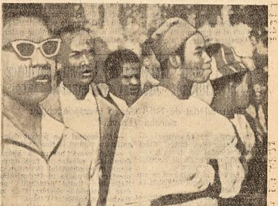
Peste 1.000 de africani au participat la o demonstrație în Piața Trațarilor (Londra), sub lozincă: „Jos miile de pe Congo”. El au trimis la O.N.U. o telegramă în care se cere demisia lui Hammarskjöld.

LEOPOLDVILLE 22 (Agerpres). — Știrile sose din Congo demonstrează că amestecul colonialiștilor în treburile interne ale Republicii Congo se intensifică. După rebeliunea militară organizată împotriva guvernului gineze central de către marioneta lor, colonelul Mobutu, colonialiștii și-au concentrat eforturile în direcția îndepărtării din Congo a unităților armate puse la dispoziția O.N.U. de două state africane — Republica Guinea și Ghana.