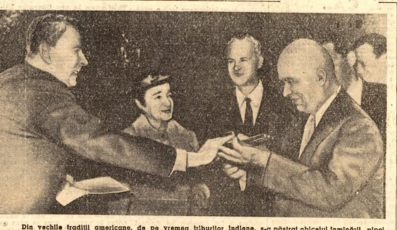
Din vechile tradiții americane, de pe vremea triburilor indiene, s-a păstrat obiceiul înmînării „pipel păcii”, ca un simbol al păcii și prieteniei. Potrivit acestui obicei, la 23 septembrie omul de știință american W. Pierce l-a vizitat pe N. S. Hrușciov la reședința sa pentru a-i înmîna o „pipă a păcii”. (Telefoto din New York)