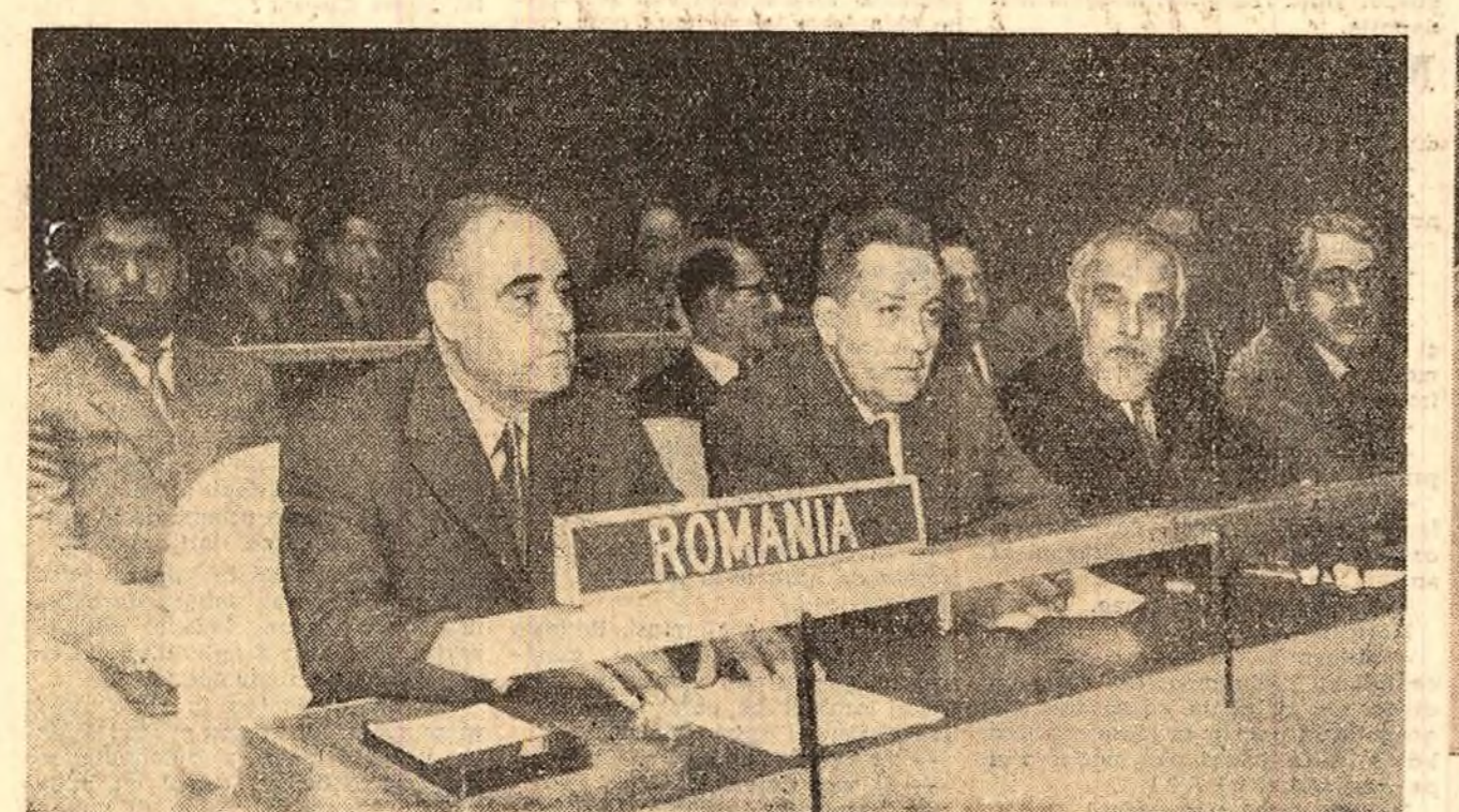
Delegația R. P. Romine, în frunte cu tovarășul Gh. Gheorghiu-Dej, la sesiunea Adunării Generale a O.N.U. în timpul desfășurării lucrărilor sesiunii.

Cu începere de la ora 20, partici-panții pot urmări întîlnirea de fotbal — în nocturnă — din cadrul catego-riei A: Dinamo București — Știința Ti-mișoara.