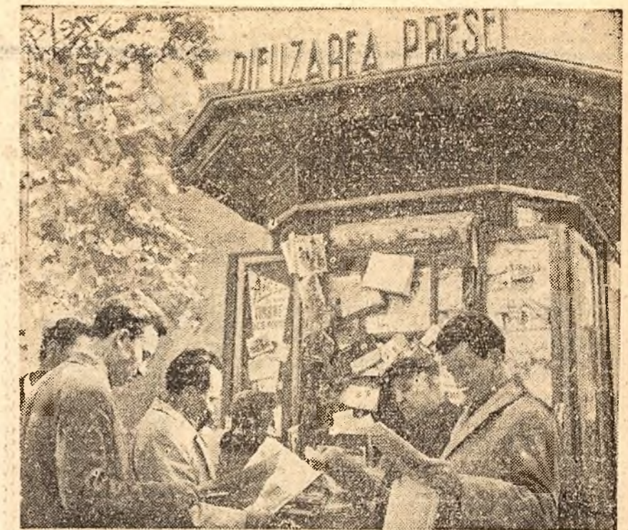
Au sosit zărele. Cu viu interes, cetățenii iau cunoștință de istoricul document al păcii, — cuvîntarea rostită de N. S. Hrușciov de la tribuna Adunării Generale a O.N.U.