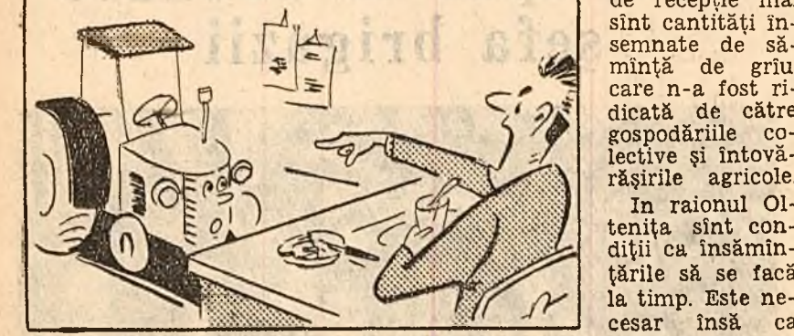
PREȘEDINTELE: În birou? Pe teren e locul d-tale.

In comuna Gruiu, raionul Oitenița, semănatul n-a început. Președintele statului popular comunal, Gh. Ștefan, stă însă liniștit în birou.