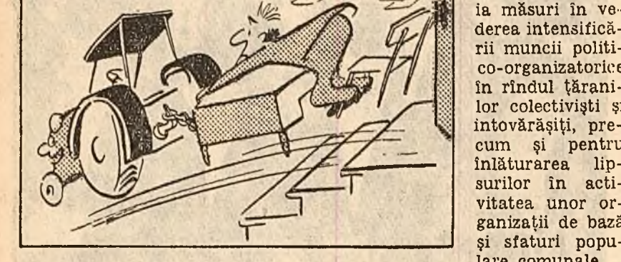
TRACTORUL: Păi, tocmai asta vîntem să vă spun și eu! (Desen de NELL COBAR) T. MARIAN