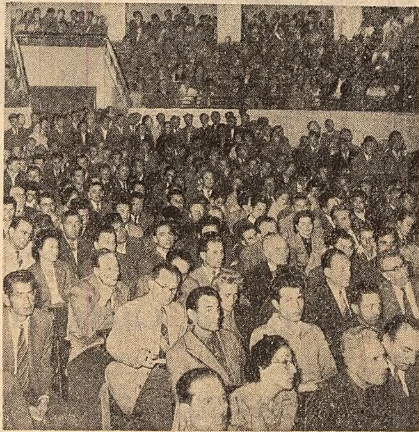
La deschiderea cursurilor Universității serale de marxism-leninism de pe lângă Comitetul Orașenesc P.M.R. Eucureșii.

Zilele acestea în întreaga țară a început noul an în învățământul de partid. În întreprinderi și instituții și-au început activitatea cea mai mare parte a cursurilor și cursurilor în cadrul cărora se studiază Istoria P.M.R., Istoria P.C.U.S., Economia politică, Bazele marxism-leninismului etc. În Capitală și în alte orașe și-au deschis, de asemenea, cursurile universitățile serale de marxism-leninism.