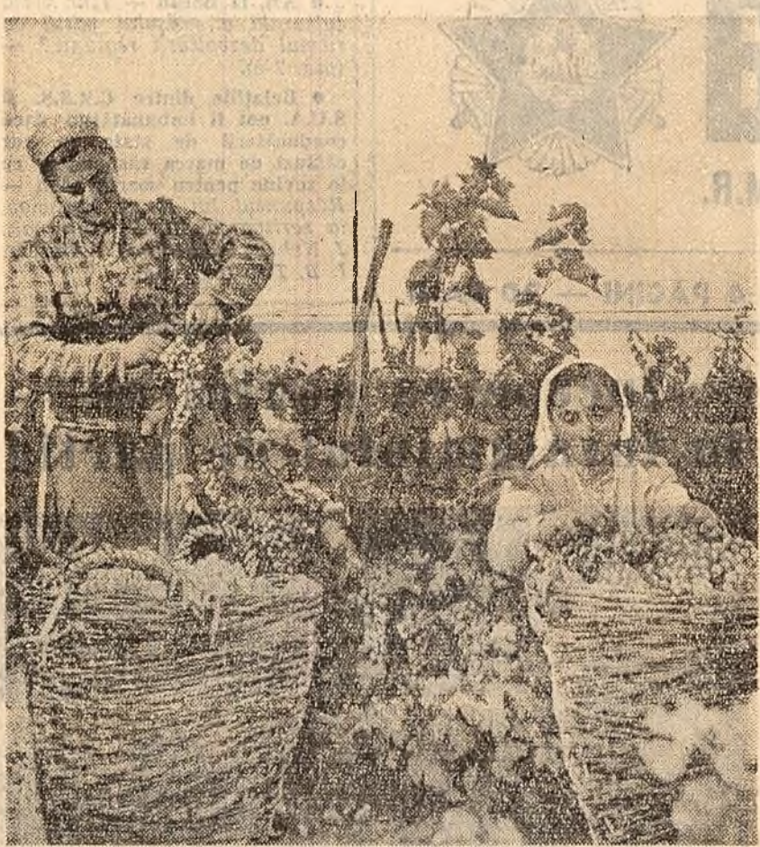
Culesul strugurilor în podgoria Tohani.

...la muzeul „George Enescu” din Capitală au loc în fiecare duminică între orele 11.30-15 și 17.30-19 oratorii muzicale pe tema „George Enescu, interpret și compozitor”.