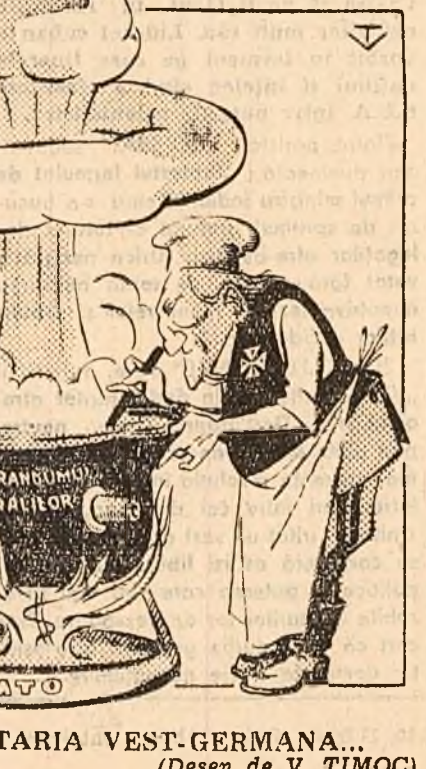
IN BUCATARIA VEST-GERMANA... (Desen de V. TIMOC)