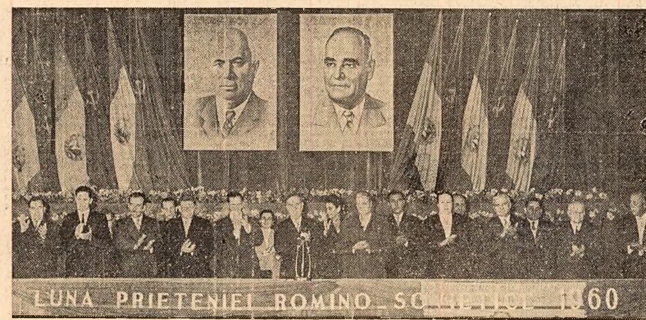
Prezidiul Adunării festive din sala Teatrului C.C.S.

Vineri 7 octombrie, la Teatrul C.C.S. din Capitală, a avut loc adunarea organizată de Consiliul General A.R.L.U.S., cu prilejul deschiderii Lunii prieteniei romino-sovietice.