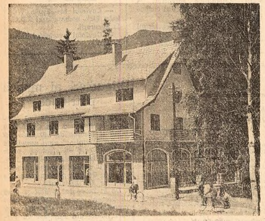
În stațiunea Tușnad, o nouă vilă pentru oamenii muncii.

Experiența din anii trecuți a arătat că activitatea unor șantiere a fost îngreunată din cauză că proiectele de organizare pentru anotimpul friguros au fost întocmite și aplicate cu întîrziere. Măsurile luate în grabă au avut ca urmare pe unele șantiere întîrzierea termenelor de predare a construcțiilor și mărirea prețului de cost. La acestea s-a adăugat și lipsa de preocupare din partea unor organizații beneficiare de investiții: ca și a unor proiectanți pentru predarea la timp a documentației tehnice a acelor lucrări definitive — ca centralele termice din cvartalele de locuințe, instalațiile de transport a energiei calorice și electrice etc. Nu există nici o justificare ca măsurile impuse de apropierea iernii să nu fie luate din vreme. Anotimpul friguros să găsească fiecare șantier cît mai bine pregătit!