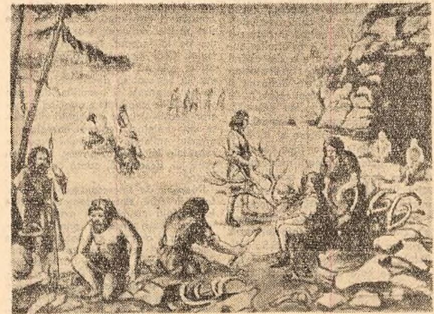
Oameni de acum 40-50.000 ani

Acum 500.000 de ani pe arena evoluției își fac apariția Pitecantropii. Ei continuă cucerirea pământului. Se răspândesc de pe coastele vestice ale Africii și din Europa până în China și Java...