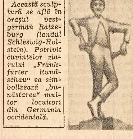
Acestă sculptură se află în orașul vest-german Ratzburg (landul Schleswig-Holstein). Potrivit cuvintelor ziarului „Frankfurter Rundschau” ea simbolizează „bunătatea” multor locuitori din Germania occidentală.