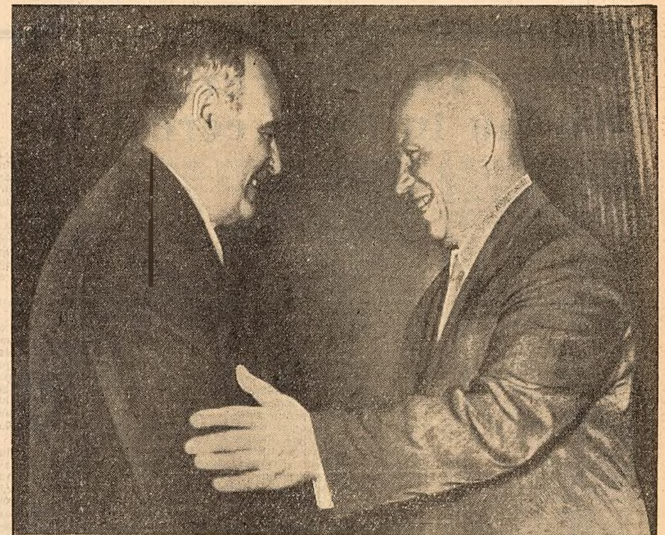
Tovarășii N. S. Hrușciov și Gh. Gheorghiu-Dej în timpul recepției de la sediul mîslunii R. P. Romine la New York

mintează din plin. In acest fel ei au semănat pînă acum grîul și seacă pe jumătate din suprafața prevăzută. Sint frunțași colectiviștii din Gingiova, Mîrșani și Gighera.