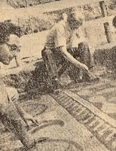
Cercetători ai muzeului „V. Pirvan” din Constanța, lucrînd la descoperirea unei porțiuni de mozaic.

De la pereți în interior pornește chenarul, lat de 6 m., format din mai multe benzi al căror decor constă din împletituri, meandre, vîrtej de leșteră cu frunze, cercuri înțelățate etc. O întreagă varietate ornamentală înțelățată în partea centrală a covorului de mozaic. Pornind de la capătul de sud-est către cel de nord-vest ale părții centrale distingem: un pătrat mare în care sînt înscrise mici carouri uniri prin colțuri în așa fel încît laturile lor închid mici suprafețe romboidale. Și unele și altele au câte un motiv ornamental geometric: împletituri, mici pătrate de culoare închisă și deschisă care dau impresia unor table de șah etc. Urmează apoi un alt mare carou în care este înscris un cerc cu diametrul de o lungime egală laturii pătratului. Interiorul cercului conține, de asemenea, ornamente cu caracter geometric și vegetal foarte complexe. Ceea ce interesează mai cu seamă aici din punct de vedere