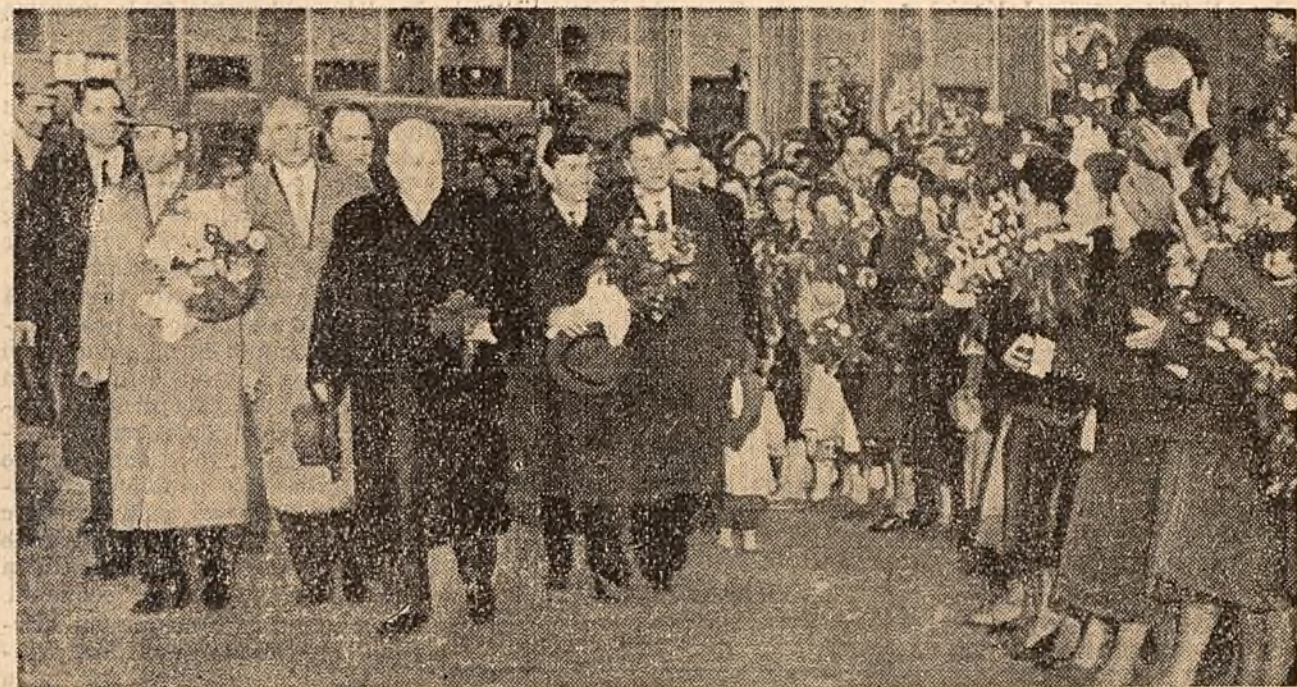
Călduroasa primire făcută lui N. S. Hrușciiov pe aerodromul Vnukovo de lângă Moscova.