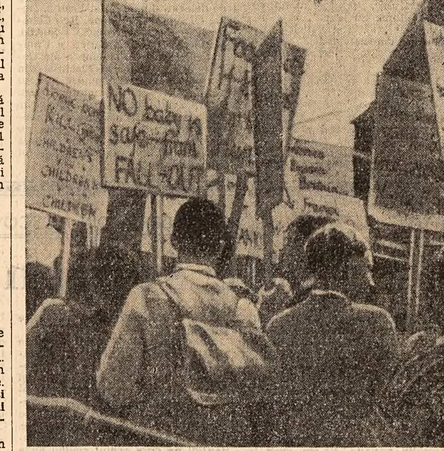
Demonstrație la Londra împotriva înarmării nucleare.