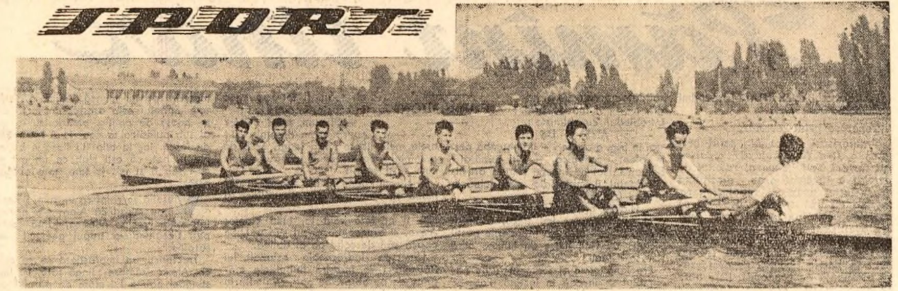
Azi și mâine, pe lacul Horăstru, ultimul concurs nautic al sezonului. În fotografie: un echipaj de 8+1 la antrenament.