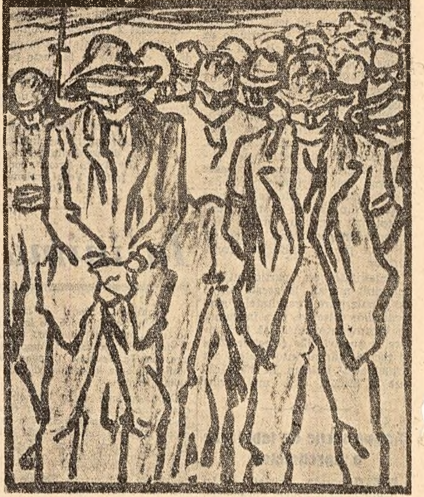
Desen de N. TONITZA (1920)

„Cenzura și starea de asediu se mențin...” (Ziarele)