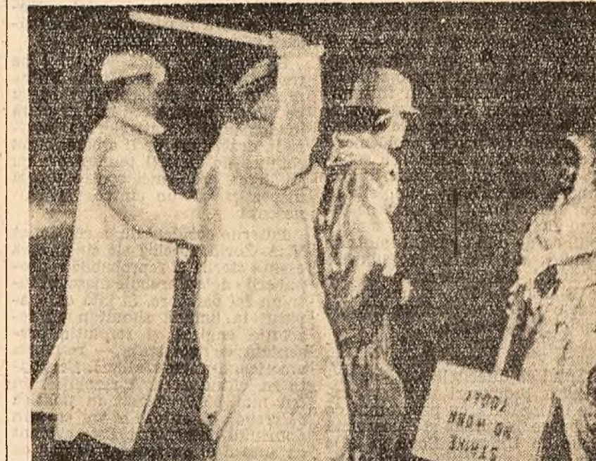
Poziția americană încearcă să înlăture prin violență un pichet de grevă în fața uzinelor „General Electric” din orașul Philadelphia.

În rechizițiul se subliniază că, pentru a șterge urmele crimelor sale, foștul guvern turc a aprobat demonstrații din Istanbul care au fost prezentate apoi drept „incidente comuniste”.