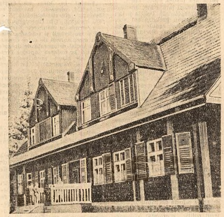
Dispensarul muncitorilor forestieri din Comandău.

PITESTI (coresp. „Scinteii”) — La întreprinderea forestieră din Băbeni, regiunea Pitești, a intrat de curind în funcțiune o nouă secție de parchete, prevăzută cu 3 linii tehnologice moderne, între care două pentru prelucrarea parchetului normal, iar a treia pentru prelucrarea parchetului lamelar. În cadrul secției, procesul de producție este în cea mai mare parte mecanizat. Secția va produce anual, pentru noile construcții de locuințe, 250.000 m.p. parchet normal și 160.000 m.p. parchet lamelar.