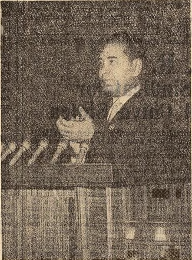
ajuns vîrstă pensionării, posibilitatea de a trăi în condiții demne.

Munca desfășurată de sindicate pentru organizarea și conducerea întrecerii socialiste a adus o contribuție de seamă la îndeplinirea de către oamenii muncii a planului de producție în patru ani. În loc de cinci, la o producție de produse industriale principale la creșterea în 1960 a productivității muncii, calculată pe cap de muncitor, cu 48 la sută față de 1955, la redu-