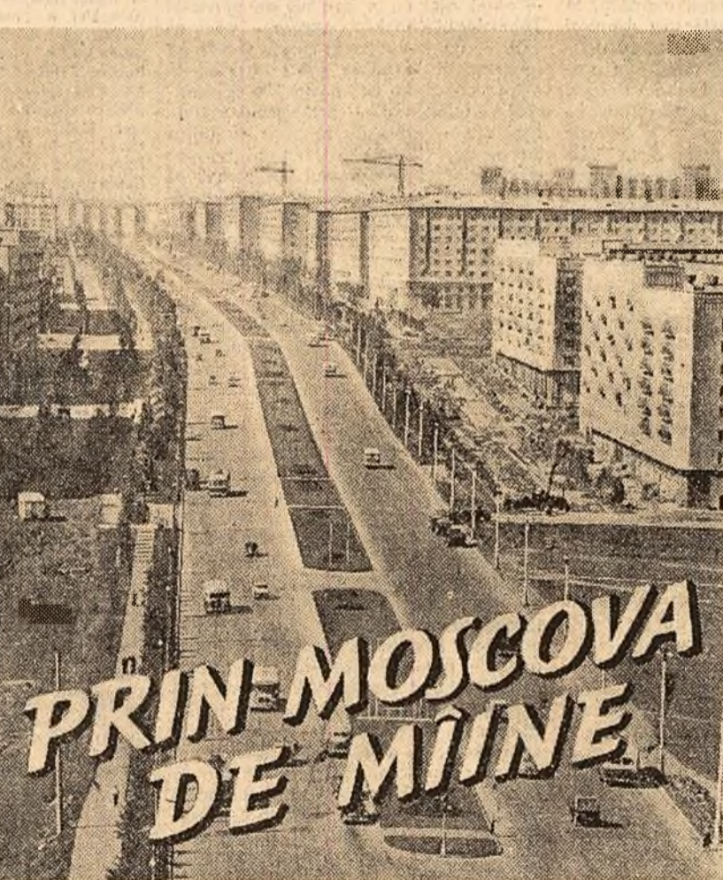
PRIN MOSCOVA DE MIINE

Noile raioane care vor lua ființă pe acest imens teritoriu vor fi construite după ca totul alte principii ca în trecut. Casele nu vor mai fi înșiruite cu fațadele lor de-a lungul unor străzi înguste și zgometoase, ci vor fi amplasate în așa fel încît să aibă cit mai mult soare, aer, verdețură... Urmează să fie reconstruit și centrul orașului, raioanele lui vechi, astfel ca pînă la sfîrșitul septenarului să nu mai existe în oraș nici una din casele vechi, necorespunzătoare cerințelor actuale, care au mai răstat pe alocuri. Vor fi păstrate numai