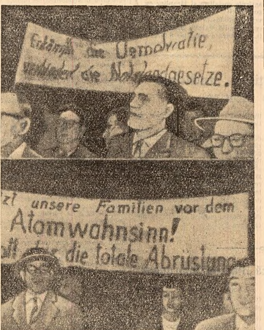
La Bochum, în Germania occidentală, mii de locuitori ai orașului au demonstrat recent împotriva legiștilor antidemocratice, pentru interzicerea armelor nucleare, pentru dezarmare generală și totală.