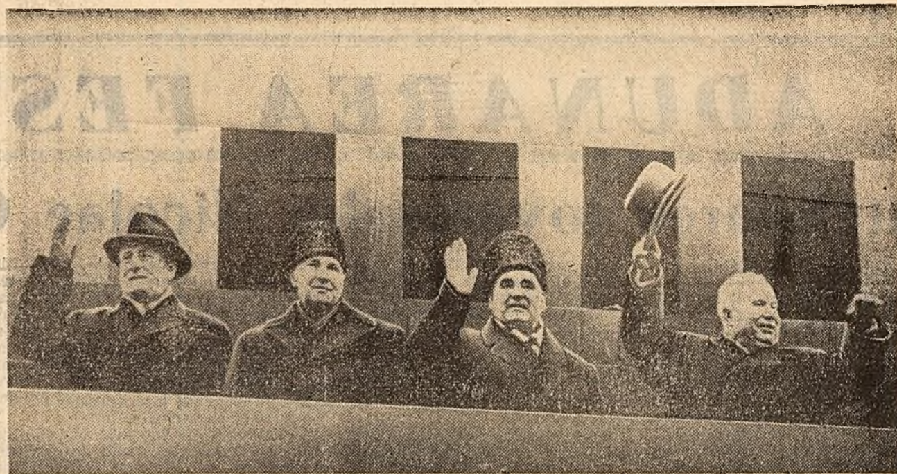
La tribuna Mauseoleului, în timpul parăzii militare și demonstrației oamenilor muncii din Moscova. În fotografie: (de la dreapta la stânga) tovarășii: Nikita Sergheevici Hrușciov, Gheorghe Gheorghiu-Dej, Kádár János, Antonin Novotný.