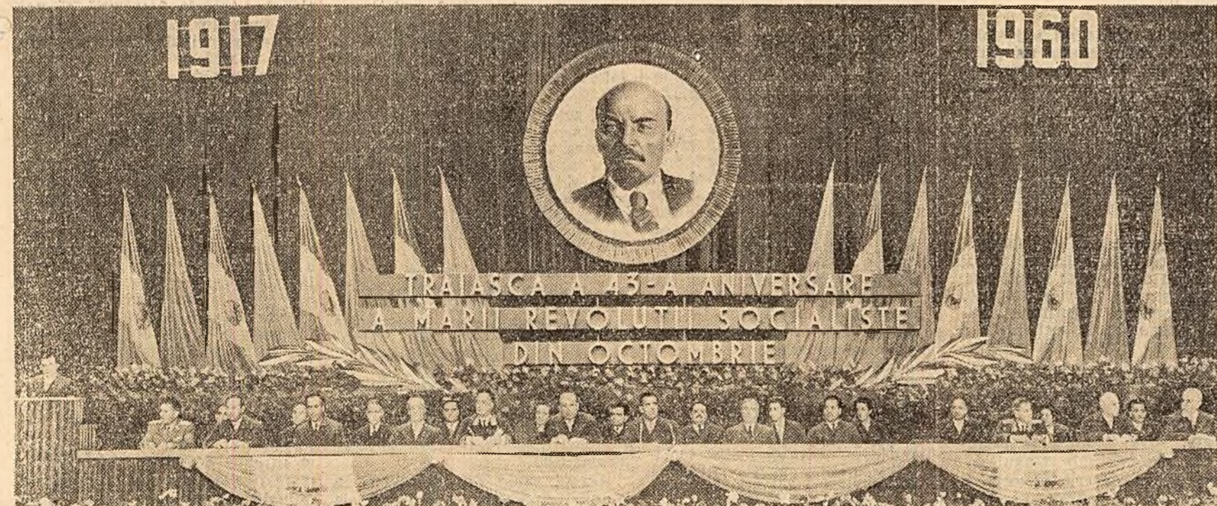
Prezidiul adunării festive din sala Palatului R. P. Romine

O contribuție hotărîtoare la cauza apărării păcii aduce Uniunea Sovietică, promovînd în fîcitate în politica externă principiile leniniste ale coexistenței pașnice.