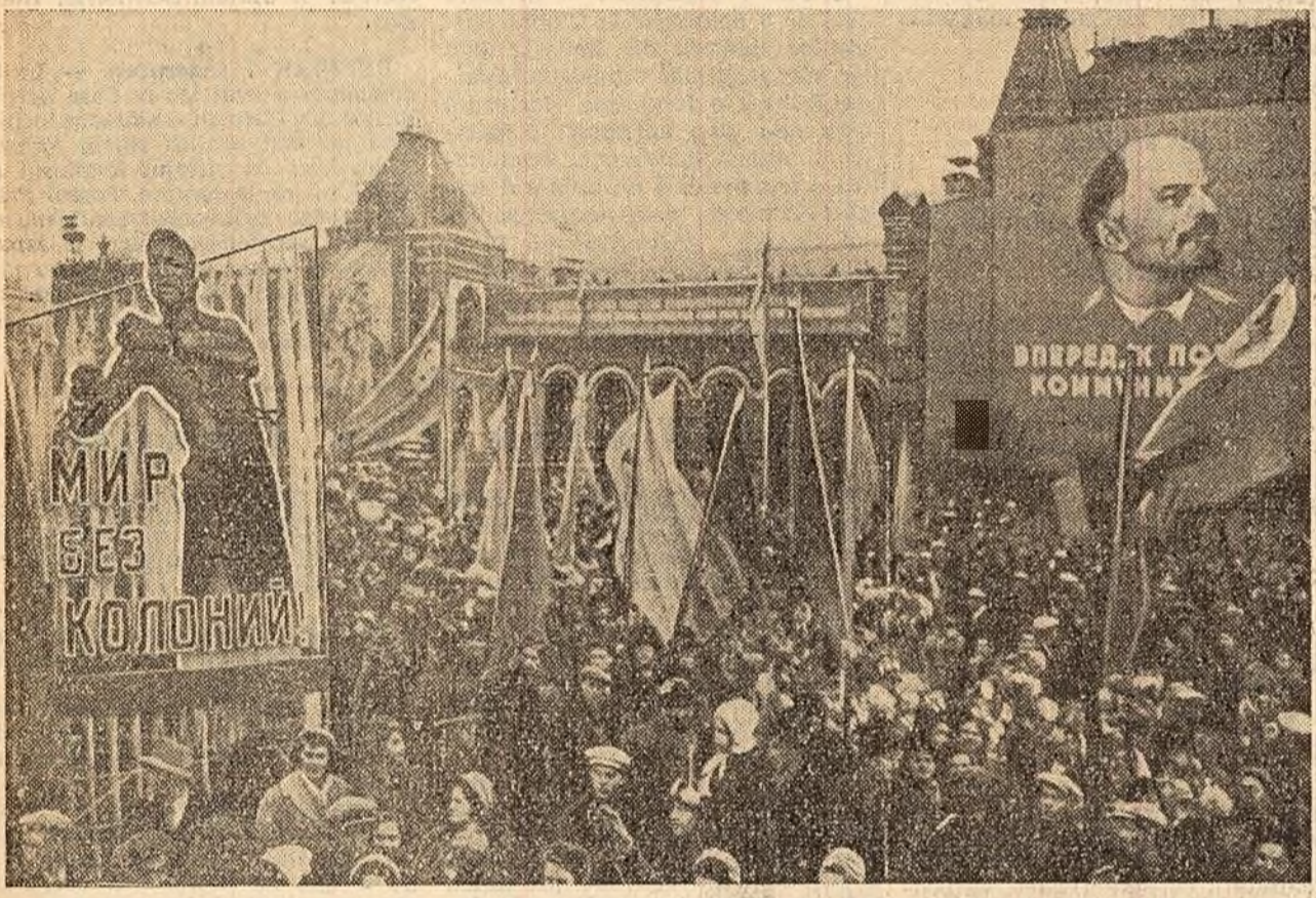
În coloane nesfîrșite reprezentanții oamenilor muncii din Moscova aclamă pe conducătorii partidului comunist și ai guvernului sovietic, salută pe înalții oaspeți de peste hotare, demonstrează hotărîrea de a obține noi succese în lupta pentru comunism, pentru pace.

În Piață răsună: „Slavă partidului! Slavă poporului sovietic!” Parada militară și demonstrația oamenilor muncii din Moscova consacrată celei de-a 43-a aniversări a Revoluției din Octombrie a durat aproape 3 ore.