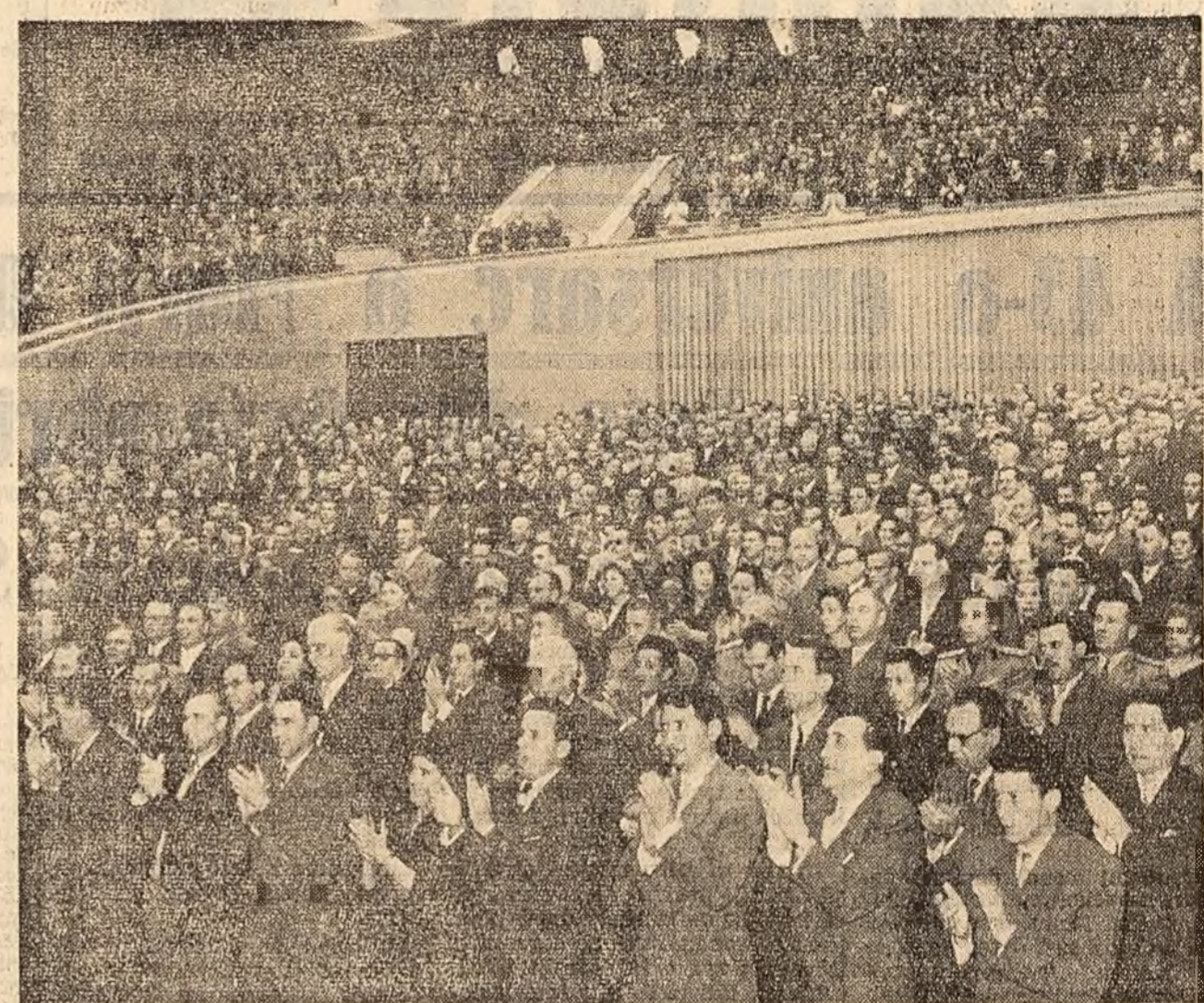
Un aspect din sala Palatului R. P. Romîne în timpul adunării festive

Revoluția Socialistă din Octombrie 1917, cea mai mărețată dintre revoluții în ce privește amploarea, profunzimea sarcinilor și telurilor sale, a însemnat o cotitură radicală în dezvoltarea societății, a deschis o eră nouă — eră prăbușirii capitalismului și a triumfului comunismului. Marea Octombrie a deschis popoarelor din toate țările o cale sigură în lupta lor pentru libertate, pace trairnică și socialism. În prezent, sub steagul socialismului au cucerit victoria și s-au unit într-un măreț lagăr monolit popoarele Chinei și ale unei serii de țări din Europa și Asia